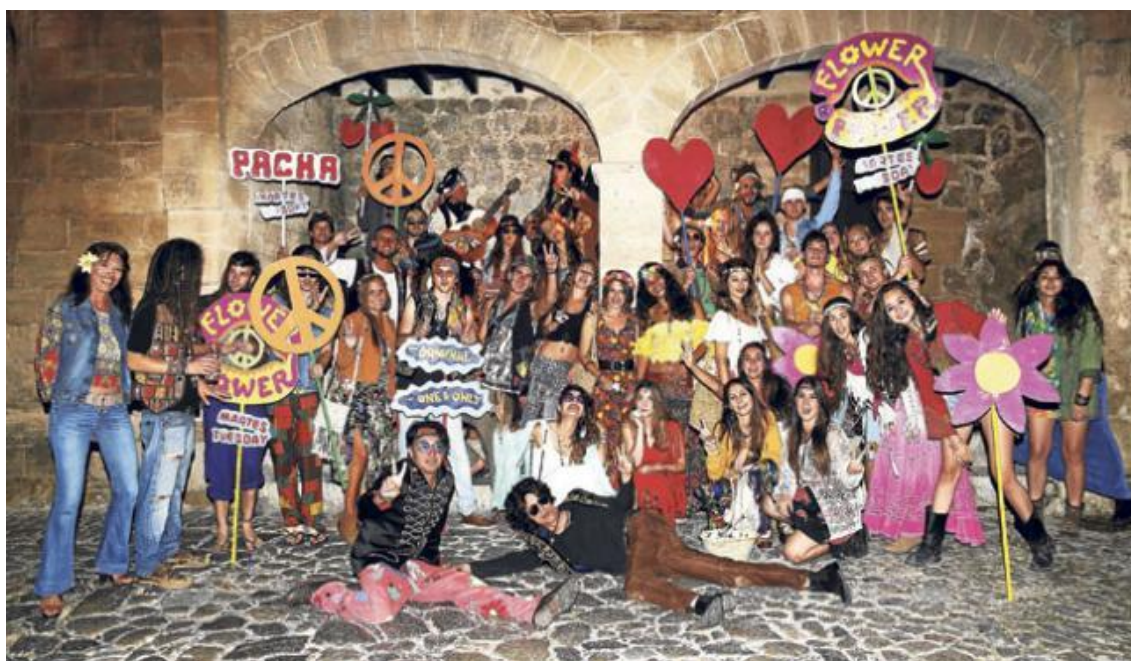
Figura 6: Pasacalles de la "Flower Power" de Pachá (2013).

grandes discotecas con la intención de captar clientes. Estas fiestas se inician pasada la media noche y se prolongan hasta las siete u ocho de la mañana, en que se produce el cierre de la discoteca. Es el producto principal de la oferta clubber y los precios de las entradas y de las consumiciones son muy elevados en comparación con otras partes del mundo, consecuencia de la relevancia mundial de las mismas, y comparados con los años ochenta.