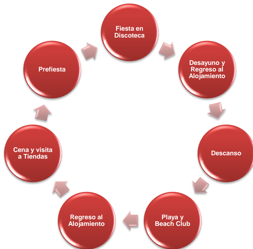
Figura 5: Esquema de la rutina diaria ideal del turista Clubber.

estrellas) y los alojamientos en viviendas, principalmente chalets en el campo.