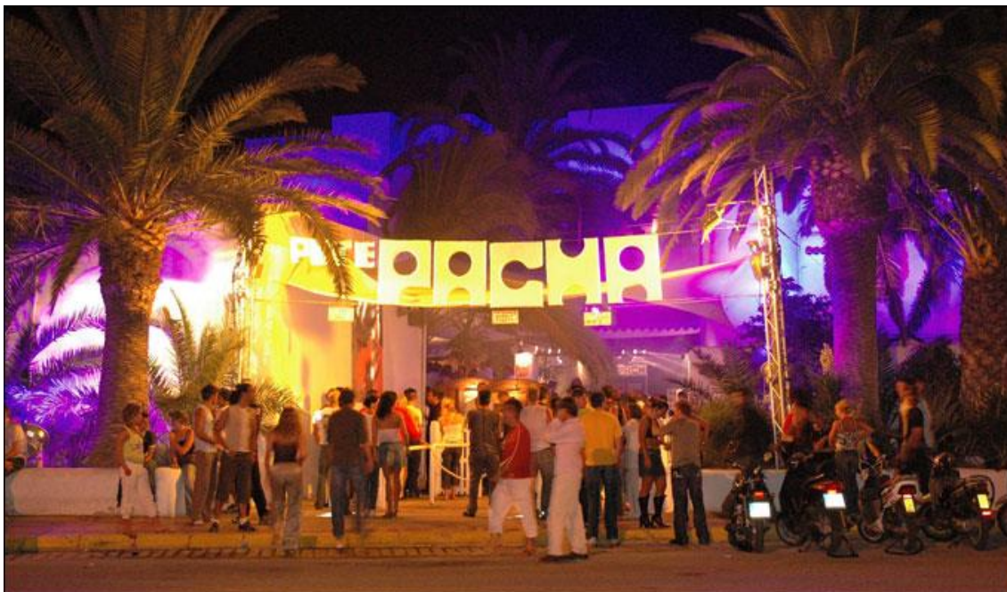
Figura 2: Discoteca Pachá en la actualidad.

"El grupo Pink Floyd se inspiró en Formentera y se instaló en Ibiza para componer algunas canciones, entre otras 'Ibiza Bar', del disco 'More'. Artistas como los Bee Gees ensayaban sus nuevas canciones en el bar Ses Guitarras de San Antonio y Cat Stevens entonaba 'Moonshadow' en las terrazas del puerto de Ibiza.... Conciertos y visitas de grandes estrellas internacionales empiezan a forjar la leyenda de Ibiza como isla de la música. Mike Oldfield se inspiró desde su casa frente a es Vedrá para componer sus obras maestras, Frank Zappa y King Crimson también recalaron en Ibiza. La cantante Joni Mitchell compone su disco 'Blue' y Nico, de Velvet Underground, se inspira en el ambiente único de la isla" ( Diario de Ibiza , 21 de agosto de 2013).