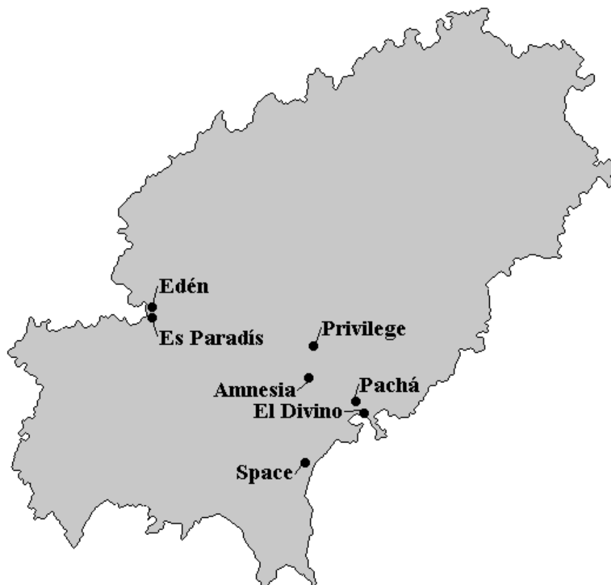
Figura 3: Las siete grandes de principios del siglo XXI.