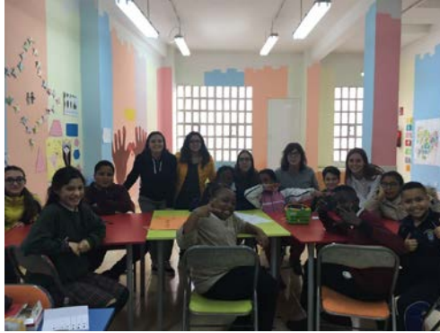
Figura 4: Colectivo de Músicos por la Paz.