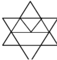
Figura 5: Actividade xeométrica.

Cantos triángulos podes atopar nesta figura?