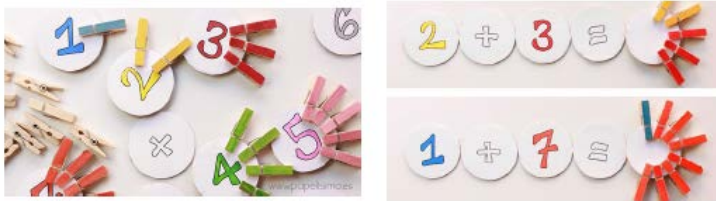
Figura 2: Material elaborado polo alumnado.