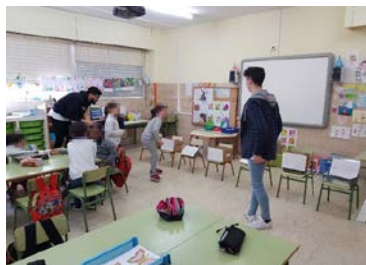
Figura 3: Actividades realizadas nun centro educativo.