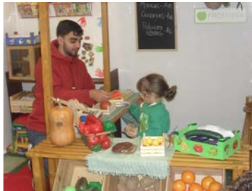
Figura 6: Xogo de rol.

Seguimento: Ao longo do proceso o alumnado estivo acompañado das orientacións tanto dos responsables das entidades como dos docentes da UdC, sabendo as datas da execución de