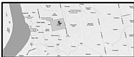
Figura 1. Bairro Nossa Senhora das Graças.

Suponha-se que esta etapa foi prejudicada pelo medo dos moradores de assalto a residência, pois é um crime comum nesta região da cidade. Verificou-se que alguns