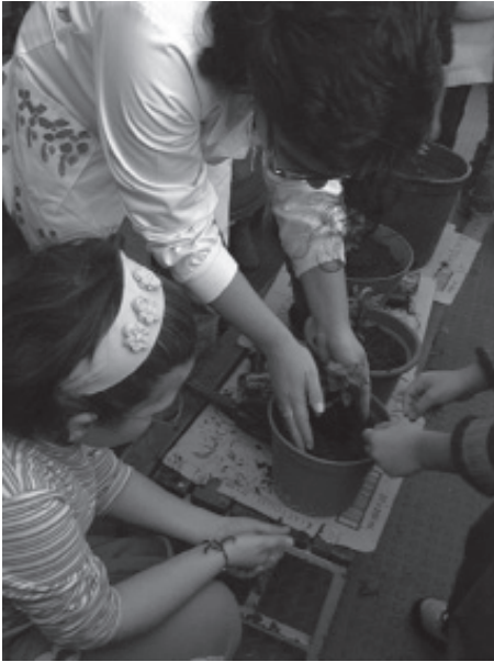
Preparar para plantar