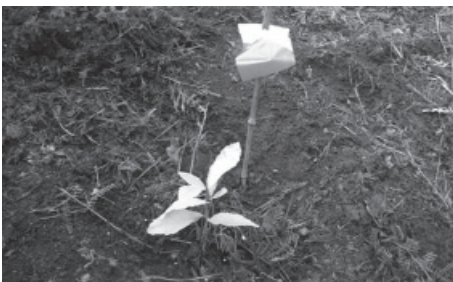
Sinalização da árvore plantada

portuguesa, os carvalhos autóctones (por exemplo Quercus faginea , Quercus robur e Quercus pyrenaica ), que constituem apenas 4% da nossa floresta atual, não possuem qualquer proteção legal.