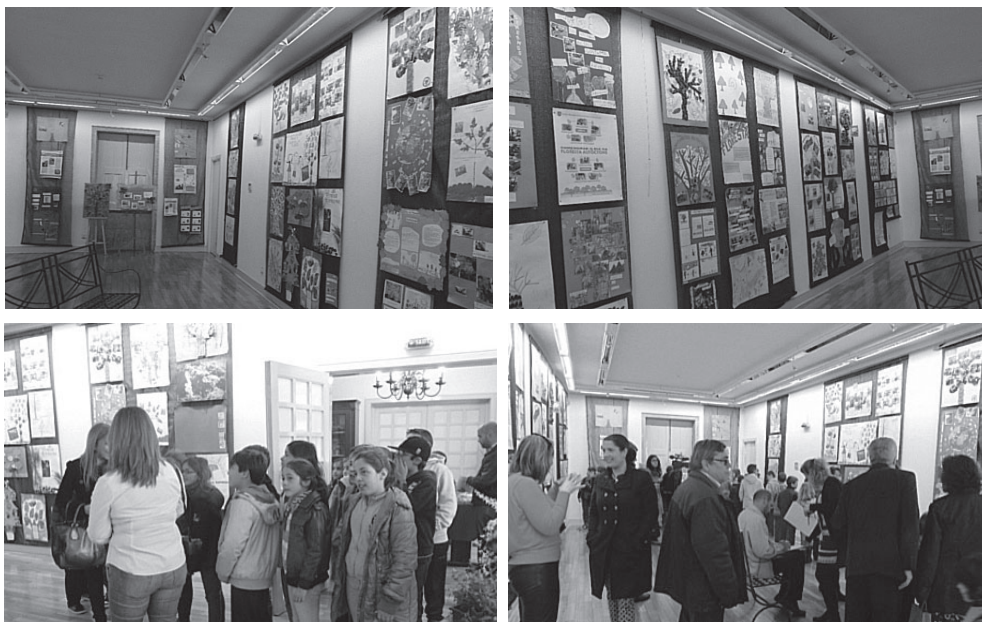
Fotografias da exposição de trabalhos no posto de turismo de Vila Nova de Gaia

Os grupos de trabalho enviam para o FA-PAS cartazes com registos das atividades desenvolvidas (cartolina formato A2, na vertical), com identificação dos autores, para constarem da Mostra em local a indicar pela Autarquia de acolhimento. A exposição estará aberta ao público durante todo o mês de Maio. São premiados os três melhores trabalhos.