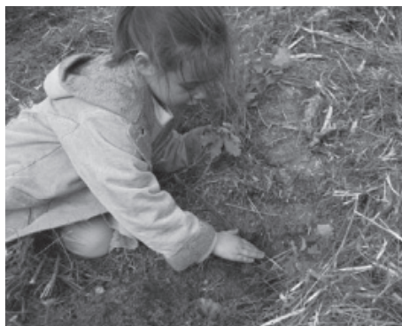
Plantar o carvalho

Segundo as conclusões da Conferência de Tbilissi, as campanhas de sensibilização e os programas de formação, apesar de fundamentais e de contribuírem para uma certa consciencialização ambiental não são suficientes para se atingir uma participação ativa. Para que se alcance este nível de cidadania são necessários aspetos essenciais como o desenvolvimento de competências (o saber fazer, a formação) a motivação e a adoção de atitudes que em conjunto conduzirão à adoção de comportamentos ambientalmente mais corretos.