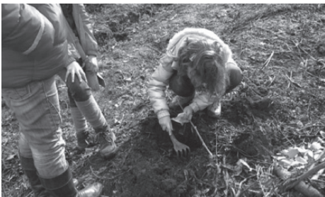
Plantação de medronho