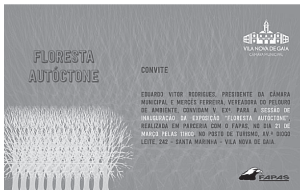
Cartazes de divulgação

No capítulo 25 da Agenda 21 refere-se ainda que as crianças e os jovens são o público-alvo preferencial para a educação ambiental visto que o desenvolvimento