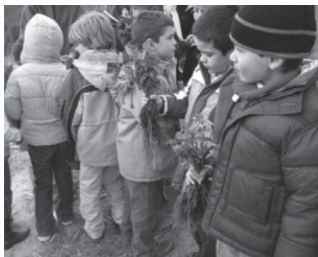
Preparar para plantar o carvalho

No capítulo 25 da Agenda 21 refere-se ainda que as crianças e os jovens são o público-alvo preferencial para a educação ambiental visto que o desenvolvimento