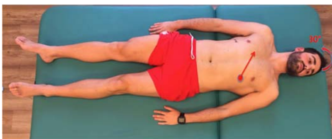
Figura 3. Posición de partida del Volteo reflejo. Zona de activación pectoral.

La locomoción refleja contiene dos patrones globales de movimiento: la reptación refleja, que se desencadena desde el decúbito prono y el volteo reflejo que lo hace desde el decúbito supino y lateral (7, 11). Estos dos patrones son denominados complejos de coordinación. Ambos están presentes de forma innata en el ser humano incluidos en el funcionamiento del SNC, figuras 3 y 4 (1,12).