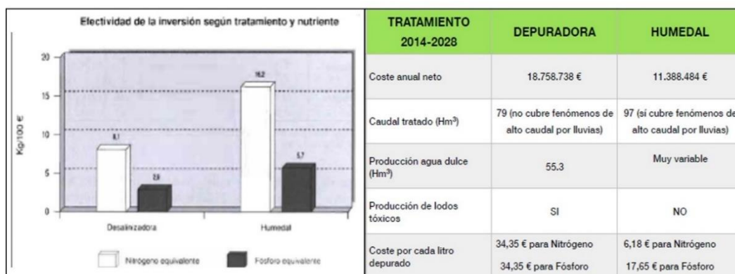
Figura 4. Materiales de la actividad “Ingenio o Ingeniería”

“¿Ingenio o Ingeniería?” Su principal propósito es contraponer para su análisis dos iniciativas de diferentes colectivos: instalar más depuradoras o aprovechar el potencial depurador de los humedales existentes en el Mar Menor. Para ello han de contrastar datos sobre efectividad, coste, contaminación, etc. (Fig. 4).