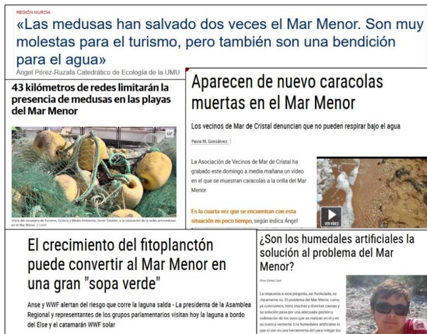
Figura 3. Materiales de la actividad “En noticia”

En la última parte de esta fase, puede ser interesante que los estudiantes comuniquen sus resultados y conclusiones mediante una exposición o un informe compartido con el resto. En cualquier caso, será importante promover una reflexión en la que contrasten sus ideas iniciales con las alcanzadas tras el desarrollo de estas actividades.