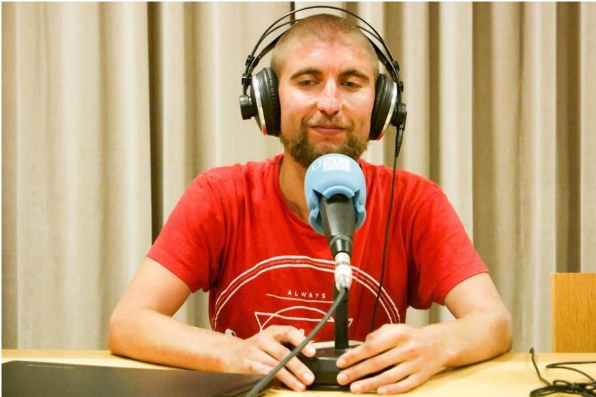
Figura 3. Momentos durante a gravación da quinta peza de Efervescencia no estudio de radio da Facultade de Ciencias de Comunicación da USC.

A quinta peza radiofónica, que se emitirá na nova tempada do programa a partir de setembro, foi gravada, a diferenza das outras, no estudio de radio da Facultade de Ciencias de Comunicación da USC (Figura 3). Nesta entrevista puiden poñer en práctica todo o aprendido previamente no obradoiro “Comunicar Ciencia na Radio” e aprender novas cousas como gravar en rigoroso directo unha entrevista a tres bandas seguindo durante todo o proceso as indicacións do técnico do estudio de gravación.