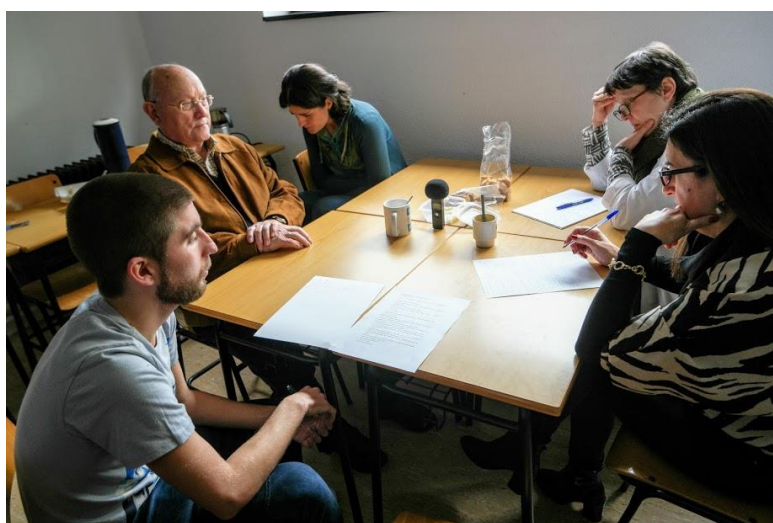
Figuras 1 (arriba) e 2 (embaixo). Momentos durante o estudo beta na Facultade de Ciencias da UDC.