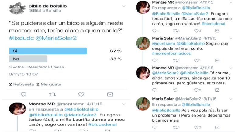
Imaxes 8 e 9. Enquisa a partir da lectura e comentario na aula d' "A repartidora de bicos", capítulo d' O meu pesadelo favorito de María Solar. 7