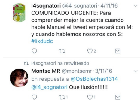
Imaxe 14. Manuel, o protagonista d' O meu pesadelo favorito ten a palabra no Twitter.

O relato da nosa experiencia vai rematando, e que mellor forma de facelo que coa última das accións, que denominamos “Convidándonos a unha viaxe emocionante”: