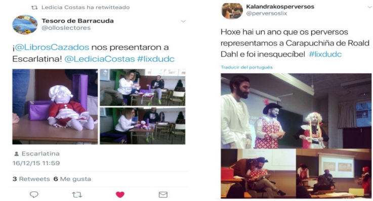
Imaxes 5 e 6. O alumnado difunde as presentacións tamén en Twitter.

Chegados a este punto, quixeramos centrarnos nese “Cómo?”, mais dun xeito mais concreto, e continuando con esa visión durativa do proxecto que lle confire o uso do xerundio. Así pois, centrarémonos tamén no que denominamos “Propoñendo retos en 140”: