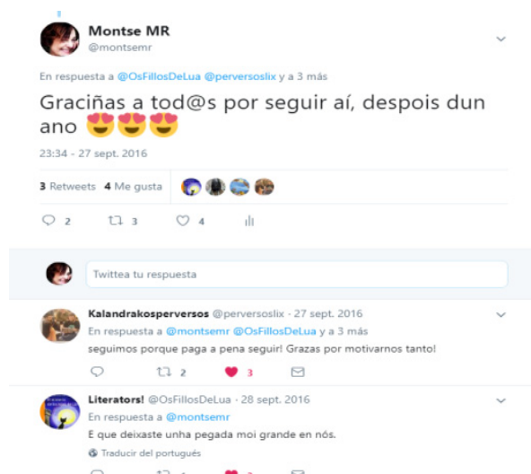
Imaxe 19. Docente orgullosa.