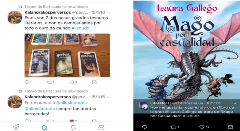
Imaxes 10 e 11. Recomendacións lectoras.