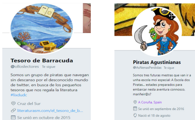
Imaxes 3 e 4. Exemplos de portada dalgunhas das contas.