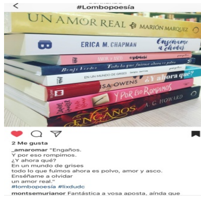
Imaxe 20. Evidencia da acción #lombopoesía.

importante difusión desta rede visual (Bañuelos Capistrán, 2015), creamos literatura en imaxes, como o proxecto #lombopoesía 9 , poesía creada cos títulos dos lombos dos libros: