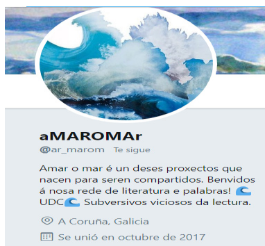
Imaxe 22. Conta de Twitter de @ar_marom

Quixéramos concluír este traballo cunha mirada cara ao futuro chea de optimismo e de confianza nas próximas xeracións de mestras e mestres. E que mellor maneira que reproducir a mensaxe de esperanza que nos deixou en Twitter a escritora Leticia Costas, Premio Nacional de Literatura Infantil (2015):