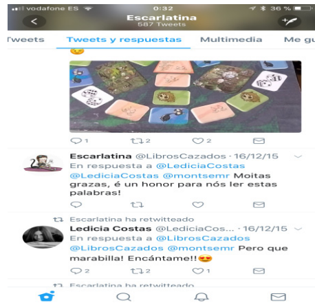
Imaxe 17. Leticia Costas, autora de Escarlatina, a cociñeira defunta , reponde ao grupo que fixo proposta de animación coa súa obra.

Son numerosas as ocasións nas que as escritoras e escritores protagonistas da nosa semana de Moodle, ou da proposta de animación á lectura grupal, interactúan con nós e co noso alumnado (véxanse imaxes 2 e 9). Os exemplos que poderíamos aportar son abundantes: