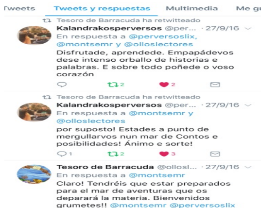
Imaxe 15. Mensaxes de alento para os grupos que inician a viaxe.