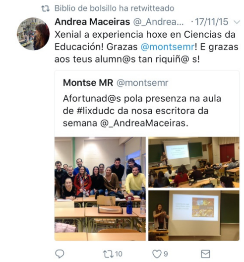
Imaxe 2. Visita da escritora Andrea Maceiras.