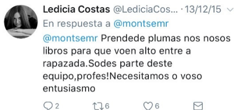
Imaxe 23. Unha porta á esperanza. Fonte: @LeticiaCostas

Quixéramos concluír este traballo cunha mirada cara ao futuro chea de optimismo e de confianza nas próximas xeracións de mestras e mestres. E que mellor maneira que reproducir a mensaxe de esperanza que nos deixou en Twitter a escritora Leticia Costas, Premio Nacional de Literatura Infantil (2015):