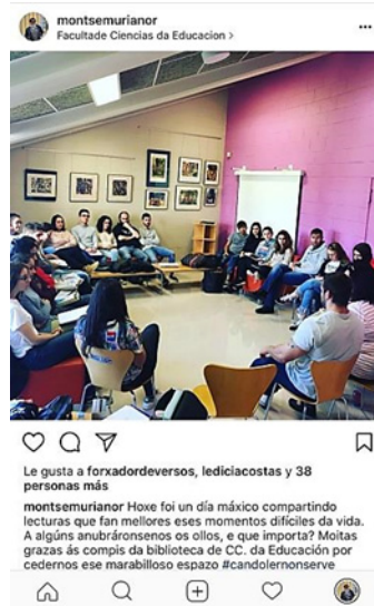
Imaxe 1. Alumnado compartindo lecturas no “Recuncho de lectura” da Biblioteca da Fac. de CC. da Educación.