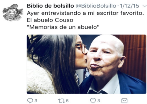
Imaxe 16. Os avós entran en #lixdudc.