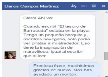
Imaxe 18. Contacto con Llanos Campos, autora de El tesoro de Barracuda , a través de Facebook.