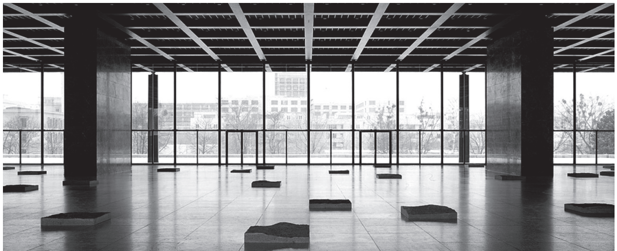
08 El espacio interior en transitividad con el exterior: interior de la Neue Nationalgalerie . Mies van der Rohe, Berlín (Alemania), 1968

La teoría esbozada en el presente artículo no sólo sitúa al espacio arquitectónico en el centro del hecho arquitectónico, sino que lo identifica con la luz que lo conforma, refiriendo distintas maneras de concebir y configurar el espacio en base a la exposición original de Giedion. Cabe advertir que no se le escapa al autor que la definición del espacio arquitectónico es algo que difícilmente puede resumirse únicamente por medio de la relación entre la luz y la sombra que lo configuran; es cierto que intervienen otros muchos factores. Pero la decisión de situar al espacio y a la luz en el centro de la reflexión surge de la idea de que la definición de la cualidad lumínica del espacio lleva implícita, por lo general, la toma de decisiones de otro orden que terminan por afectar —de un modo directo o