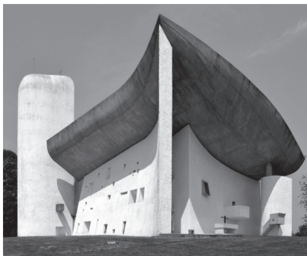
04 El espacio arquitectónico como interior en transitividad con el exterior: vista exterior de la interpenetración entre el volumen y el espacio interior en la capilla de Notre-Dame-du-Haut. Le Corbusier, Ronchamp (Francia), 1950/55