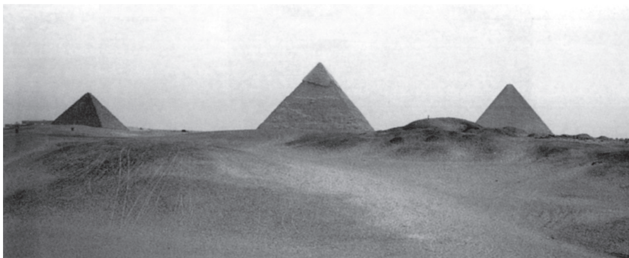
01 El espacio arquitectónico como espacio exterior: pirámides de Giza vistas desde el suroeste. Giza (Egipto), 2540 a.C.