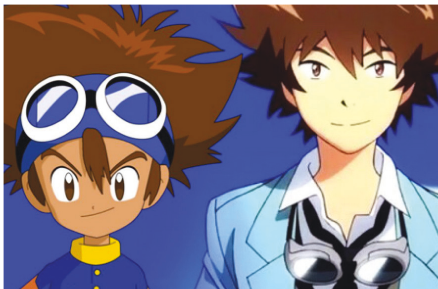
Figura 2. Evolución física del protagonista principal