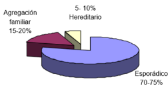
Fig. 2: Clasificación y frecuencia del cáncer de mama