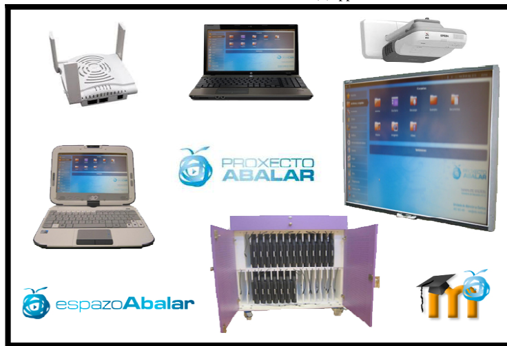
Figura nº 2. Elementos del aula Abalar

En estos momentos estamos participando en el proyecto de carácter experimental de EDIXGAL (84 centros en toda Galicia), una plataforma de aprendizaje virtual en la cual los alumn@s acceden a contenidos curriculares "completos y gratuitos" facilitados por la Xunta, así como a aquellos elaborados por los propios docentes en los centros educativos.