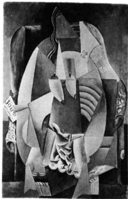
Lámina 2. PICASSO. Mujer en camisa sentada en un sillón (1913)