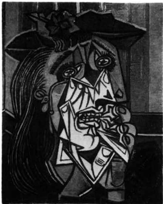
Lámina 1. PICASSO. Mujer llorando (1937)