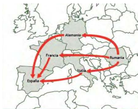
Ilustración 3. Ruta Rumanía-España