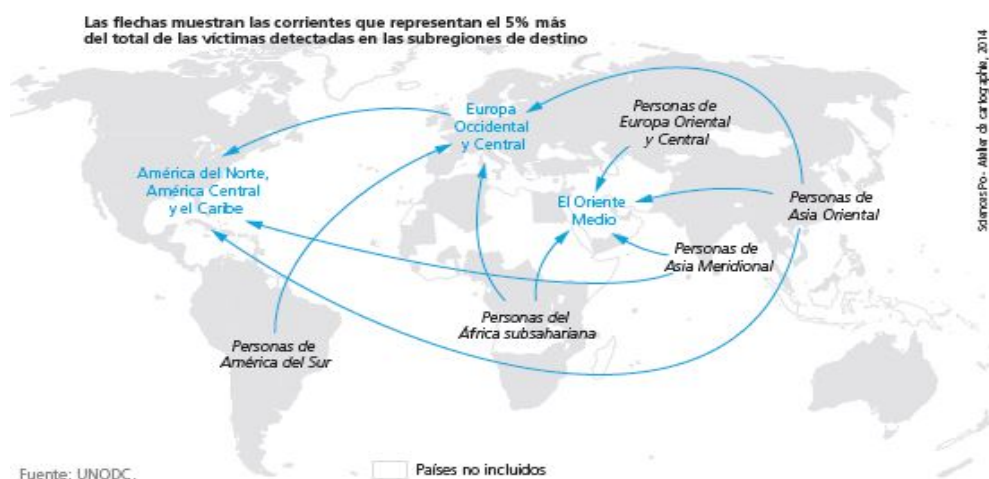
Ilustración 1. Principales zonas de destino de las corrientes de trata transregionales (en azul) y principales orígenes

En la actualidad existen tres principales corrientes transnacionales, detectándose en los países ricos de Oriente Medio, Europa Occidental y América del Norte. Generalmente, estas corrientes afectan a víctimas de Asia Oriental y Meridional y del África Subsahariana. (UNODC, 2014).