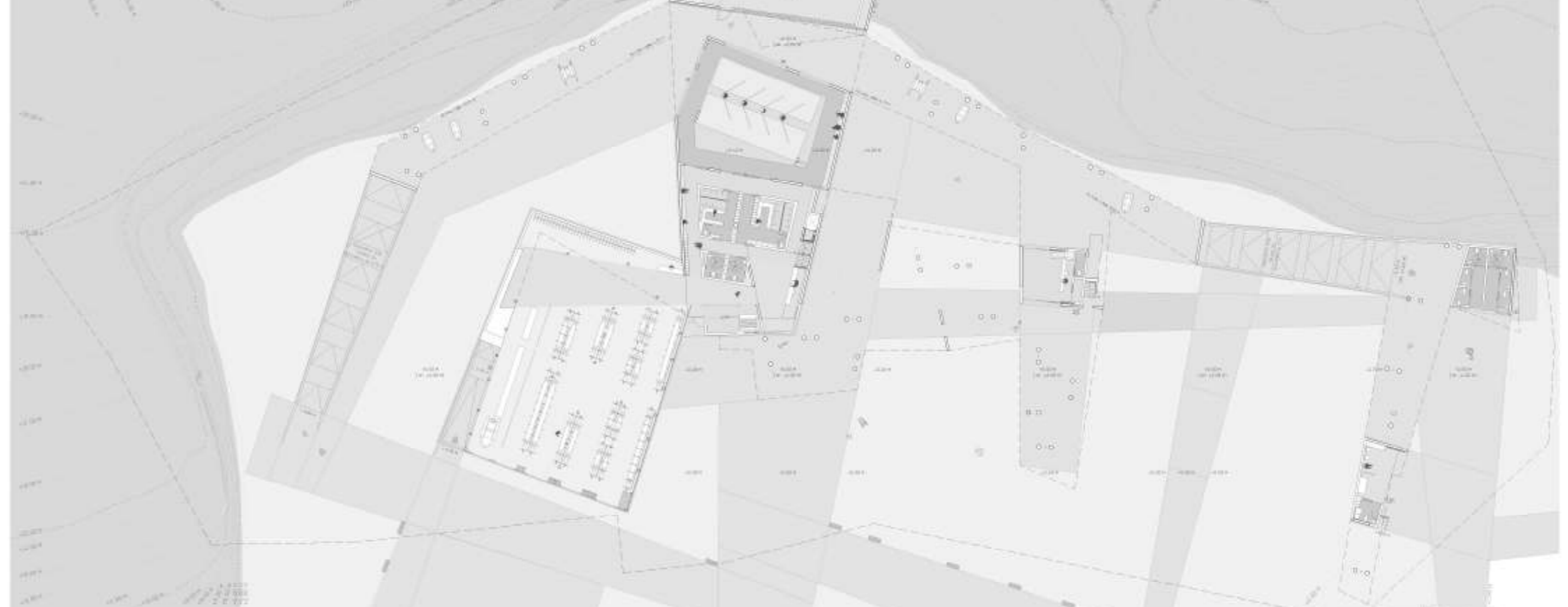
PLANTA COTA +500 M / +420 M / +370 M