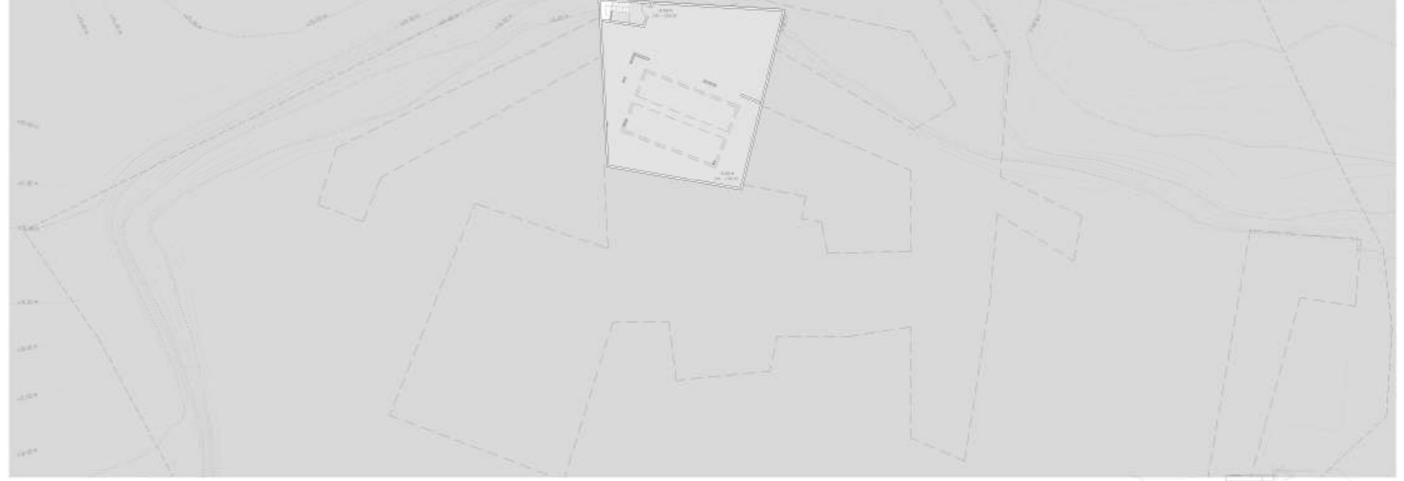
PLANTA COTA +000 M