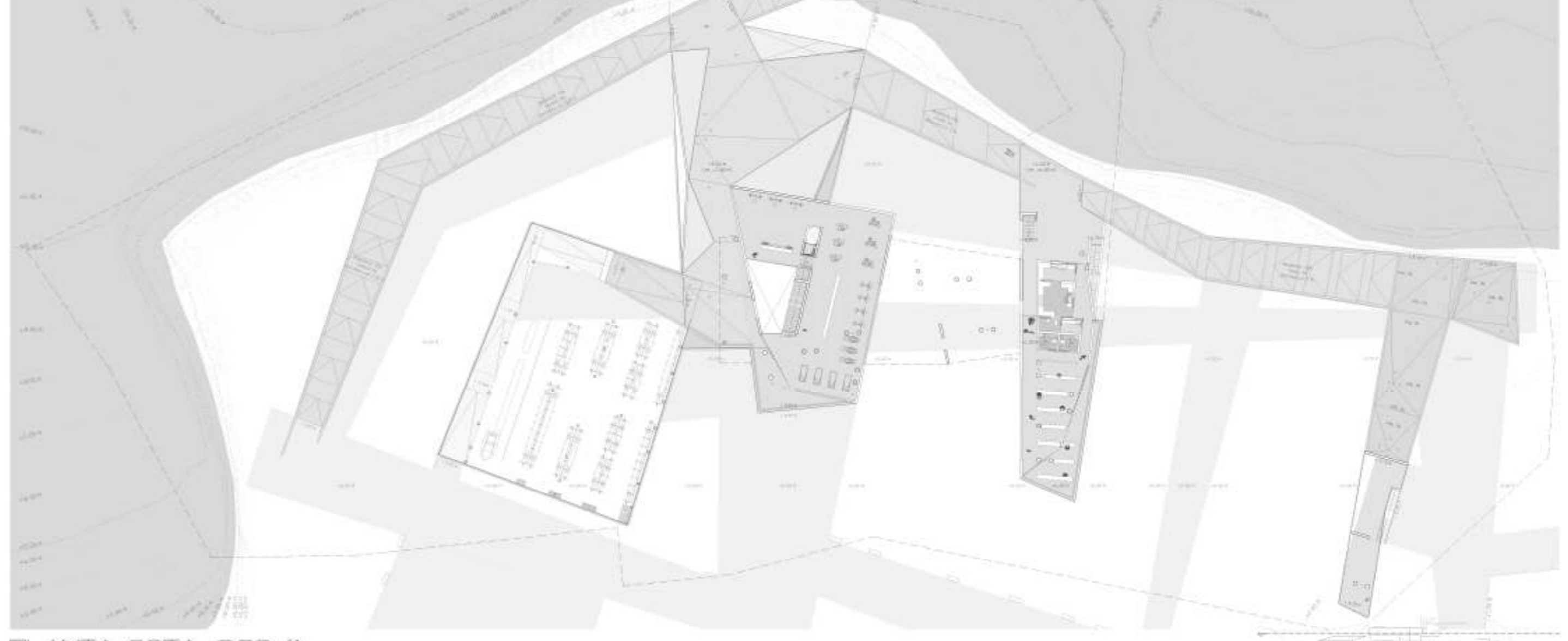
PLANTA COTA +920 M