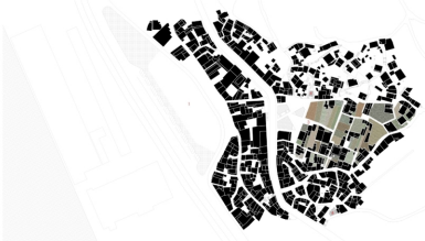
PLANO DE ESPACIO Propuesta urbana y espacialización