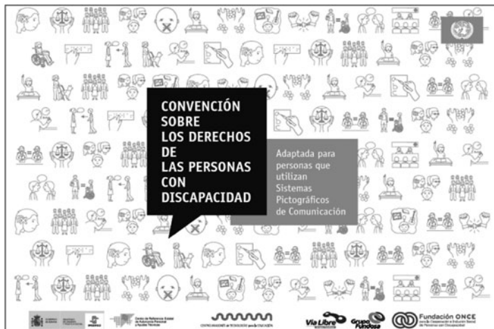
Figura 3. Portada del Documento: “Convención sobre los derechos de las personas con discapacidad adaptada para personas que utilizan Sistemas Pictográficos de Comunicación”

Ya en la Declaración Universal de Derechos Humanos se recogía el derecho de toda persona a tomar parte libremente en la vida cultural de la comunidad, (...) y a participar en el progreso científico y en los beneficios que de él resulten (art.27). Así, los avances que la Sociedad de la Información y la Comunicación está poniendo a disposición de las personas con discapacidad dibujan una sociedad más justa, preocupada por romper barreras y por ofrecer a todas las personas las herramientas necesarias para ser partícipes de la misma en igualdad de condiciones. El Decálogo de León por la Accesibilidad (2008) recoge, entre sus puntos, que la Sociedad de la Información y del Conocimiento solo será un proyecto completo cuando todas las personas puedan participar y beneficiarse del potencial que las nuevas tecnologías nos ofrecen y nos ofrecerán en el futuro.