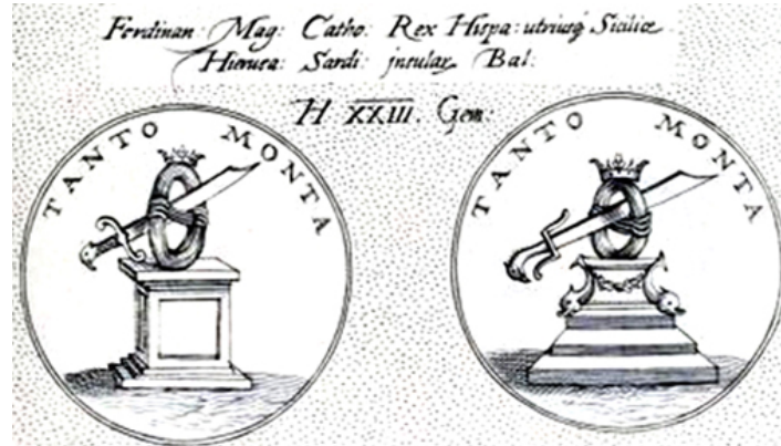
Fig. 7. Typoyius, Symbola