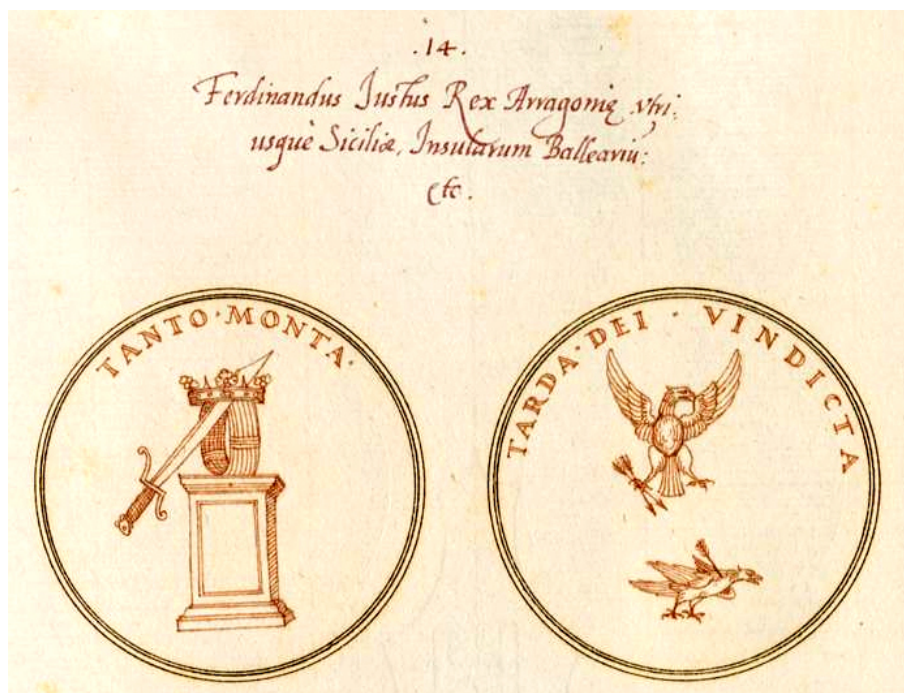
Fig. 8. Strada, Symbola Romanorum imperatorum...