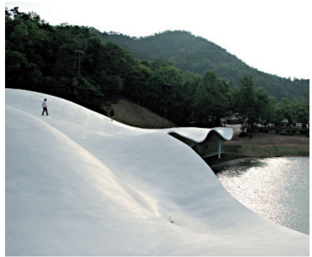
5-6 Toyo Ito, crematorio Kakamigahara, Gifu, Japón, 2004-2006. Planta de situación y vista exterior

hara (2005), ubicado en el lugar de Meiso no mori , o bosque de la meditación, obra de Toyo Ito (Fig. 05).