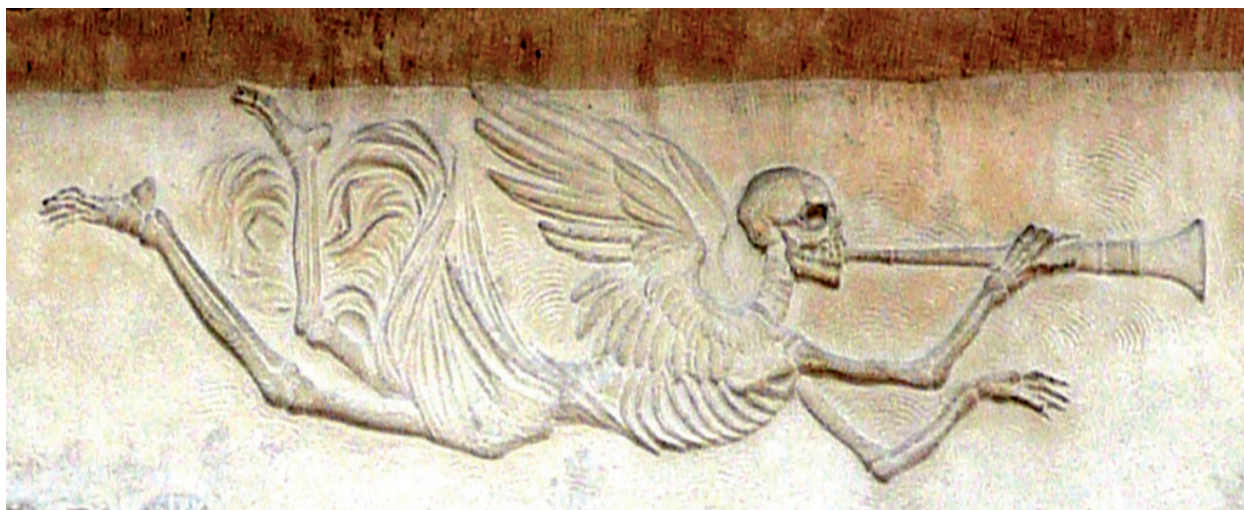
1 Detalle de tumba en el cementerio Père Lachaise, París