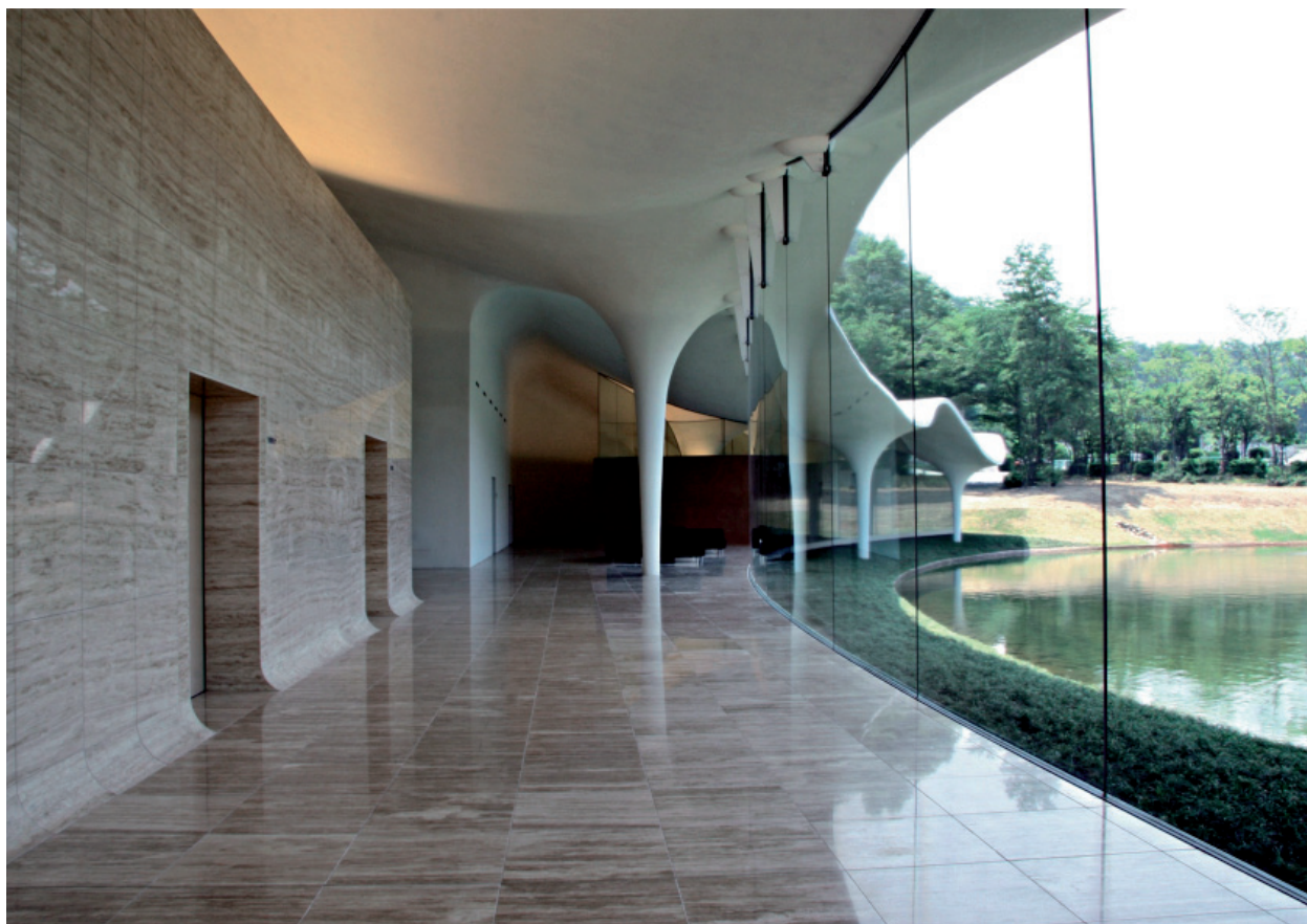
7-8 Toyo Ito, crematorio Kakamigahara, Gifu, Japón, 2004-2006. Vista del exterior y vista del interior