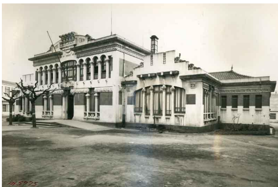
Imagen 2. Edificio de las escuelas totalmente finalizado

clases" 89 , a "observar en ellas una ejemplar conducta, prestando además la mayor atención a sus estudios para obtener un gran aprovechamiento" 90 . Deberes cuyo incumplimiento era motivo de sanción, de modo que aquellos alumnos que no obtuviesen el aprovechamiento debido y entorpeciesen la marcha de las clases por "su mal comportamiento, desaplicación o falta de asistencia injustificada a las clases", serían "dados de baja a propuesta de los profesores al Sr. Presidente de las Instituciones, perdiendo todo el derecho a ser admitidos nuevamente en la escuela profesional" 91 .