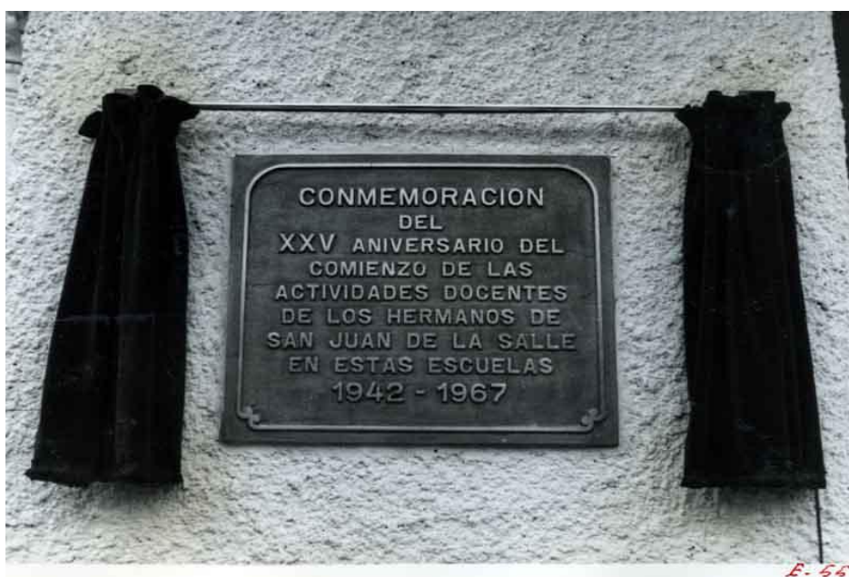
Imagen 1. Placa conmemorativa.

las Escuelas de Formación Profesional 22 . De acuerdo con lo allí regulado, resultaba que el ingreso en la escuela estaba condicionado al cumplimiento de una serie de condiciones, siempre sobre la base de que la Escuela de Preaprendizaje de la empresa se creaba con capacidad para 500 hijos de obreros y que necesariamente debían estar comprendidos entre los 8 y 12 años no cumplidos antes de empezar el curso 23 .