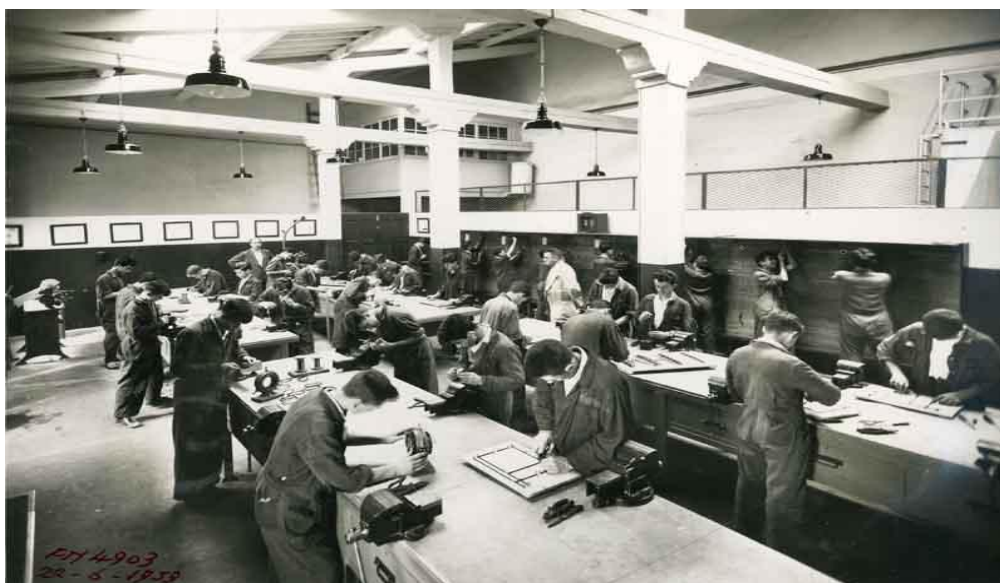
Imagen 2. Desarrollo de los programas formativos.

de superaciones parciales que permita facilitar al alumno los conocimientos precisos para el adecuado ejercicio de la profesión correspondiente" 64 (ver imagen 2).