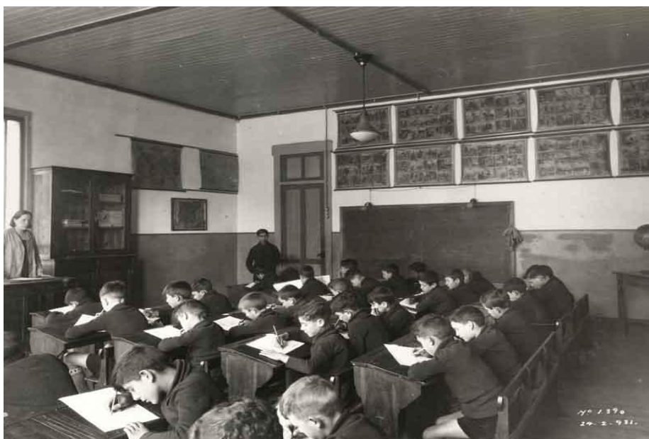
Imagen 2. Aula de formación

7. También en el Reglamento de las escuelas se recogía todo lo relativo a la asistencia, horario de entrada y salida de los estudiantes, alimentación, edificaciones y régimen disciplinario. En efecto, se regulaban en este Reglamento cuestiones necesarias para el buen funcionamiento de las escuelas y la formación de los estudiantes. Siempre según el Reglamento, eran cuestiones tales como: 1) la asistencia obligatoria, que era "todos los días de clase, por la mañana y por la tarde", "los domingos y fiestas, a los actos religiosos y culturales reglamentarios", y "en los casos especiales que la dirección determine" 33 ; 2) la jornada escolar, que era "por la mañana, a las 9 entrada,... a las 12 salida, por la tarde, a las 14,30 entrada y a