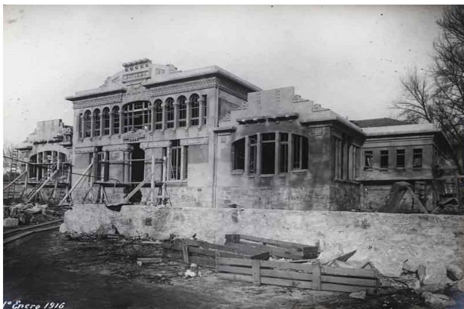
Imagen 1. Construcción de las escuelas

15. La puesta en funcionamiento de la Escuela de Formación Elemental se hizo realidad en el año 1916, luego de haberse superado por la presión de los trabajadores ciertas reticencias iniciales de la Sociedad Española de Construcción Naval. Y es que la presión ejercida por los operarios del arsenal fue determinante para que la empresa no se dilatase más en el cumplimiento de sus obligaciones contraídas por la firma del contrato de 16 de junio de 1909 con el Estado. Así, por Real Orden de 12 de abril de 1913 47 , se tiene conocimiento, primero, del empeño de los trabajadores para que la empresa cumpla sin más demora, y segundo, de la contestación que en este sentido se da por parte de los Poderes Públicos, afirmándose en dicha Orden lo siguiente: "en