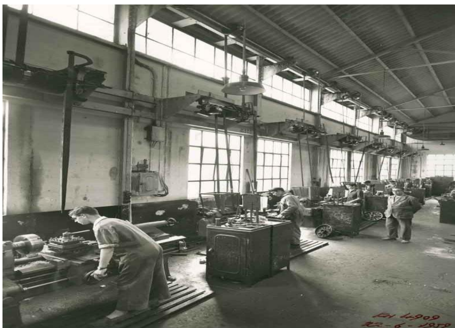
Imagen 5. talleres