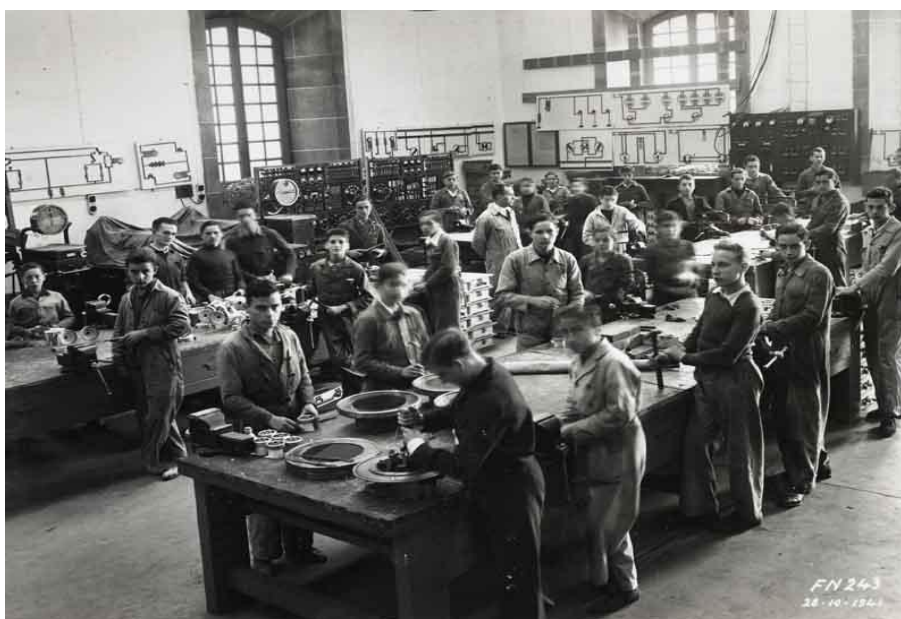
Imagen 4. talleres

de los departamentos deberán atender las sugerencias de los que tengan aprendices de algunos de sus oficios" 160 (véanse imágenes 4 y 5, sobre Talleres).