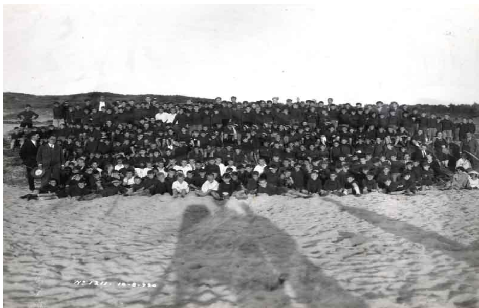
Imagen 6. campamentos de vacaciones

afectada por el derecho de los aprendices a un permiso más o menos largo, dado que "los aprendices de la factoría tendrán derecho a un permiso o vacaciones anuales de 15 días naturales, de acuerdo con lo dispuesto por el Ministerio de Trabajo para el personal masculino menor de 21 años" 242 , además —y con independencia de lo señalado anteriormente— "aquellos aprendices designados por el Frente de Juventudes, para la asistencia a los campamentos de verano, podrán disfrutar de un permiso de 20 días en lugar de los 15 antes señalados" 243 (véase imagen 6).