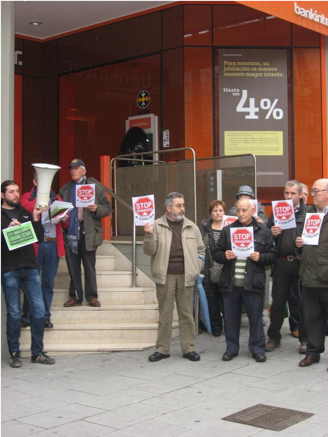
Descripción: Concentración de Stop Desahucios Coruña ante una sede financiera