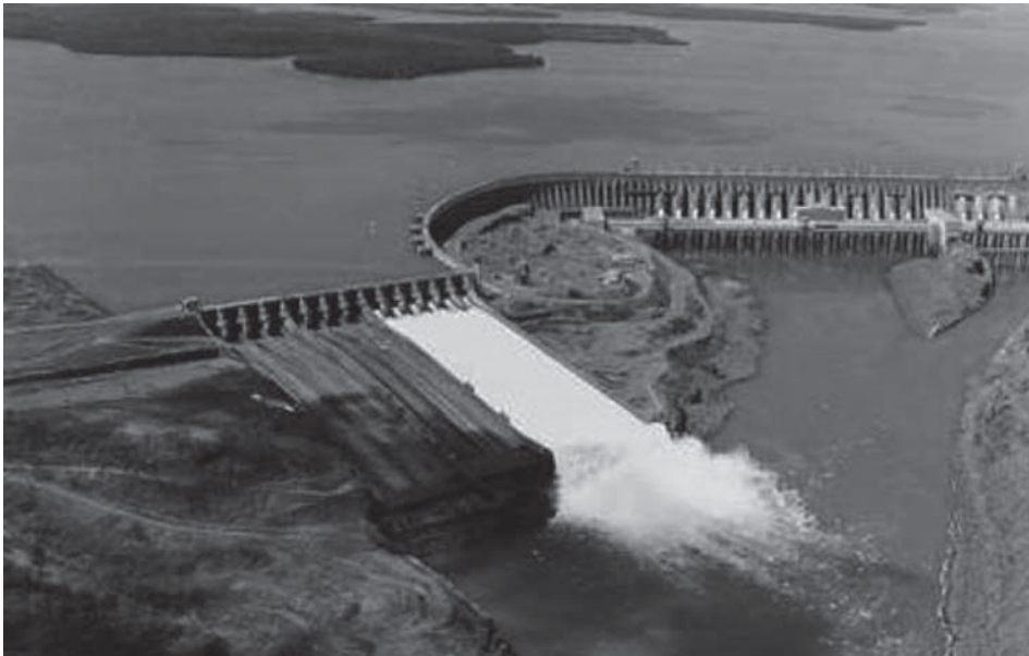
Figura 1 – Panorámica de la UHIB

La figura 1 ilustra la visión panorámica de la UHIB