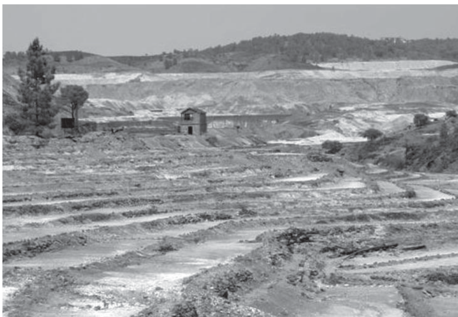
Figura 3. Paisaje minero de Riotinto (Huelva)

La zona minera experimentó en el siglo XIX el momento de mayor apogeo industrial, demográfico y económico. En 1873 un consorcio británico compró las minas al Estado y fundó la Río Tinto Company Limited (en adelante, RC Ltd.) A partir de entonces se abrieron cortas de explotación y se desarrolló la minería interior. En 1888, las calcinaciones de minerales al aire libre o “teleras” propiciaron la primera manifestación severa de impacto ambiental en la zona.