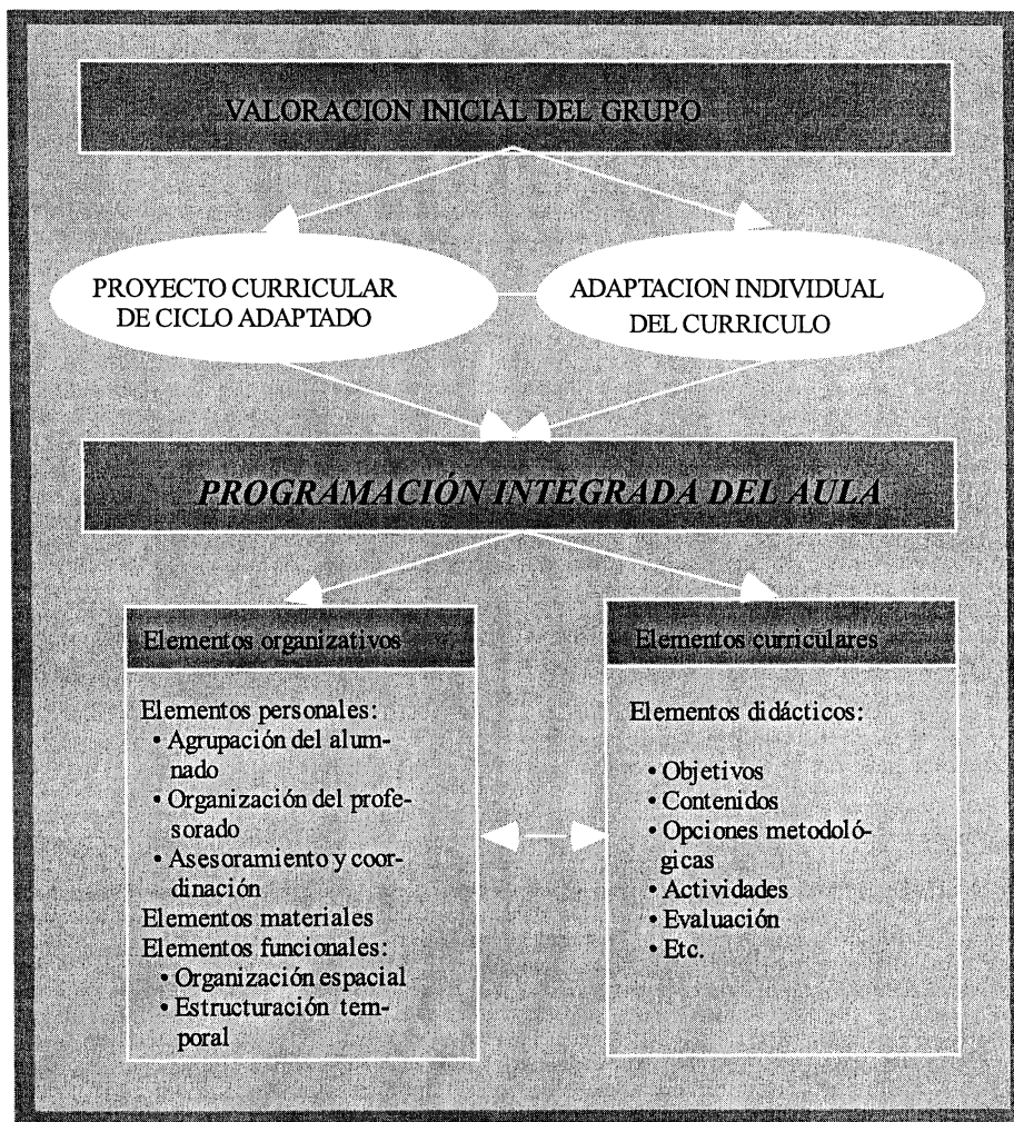
Gráfico 2. Elementos de una Programación Integrada de Aula.

considerados “ordinarios” por una parte, y por otra adaptaciones y recursos definidos para los alumnos/as mal llamados “de integración”. La verdadera igualdad de oportunidades supone tratar a cada uno de acuerdo a sus características personales. Estamos, por tanto, ante una cuestión de principio: la atención a la diversidad, y no ante una cuestión de tipología o clases de diversidad.