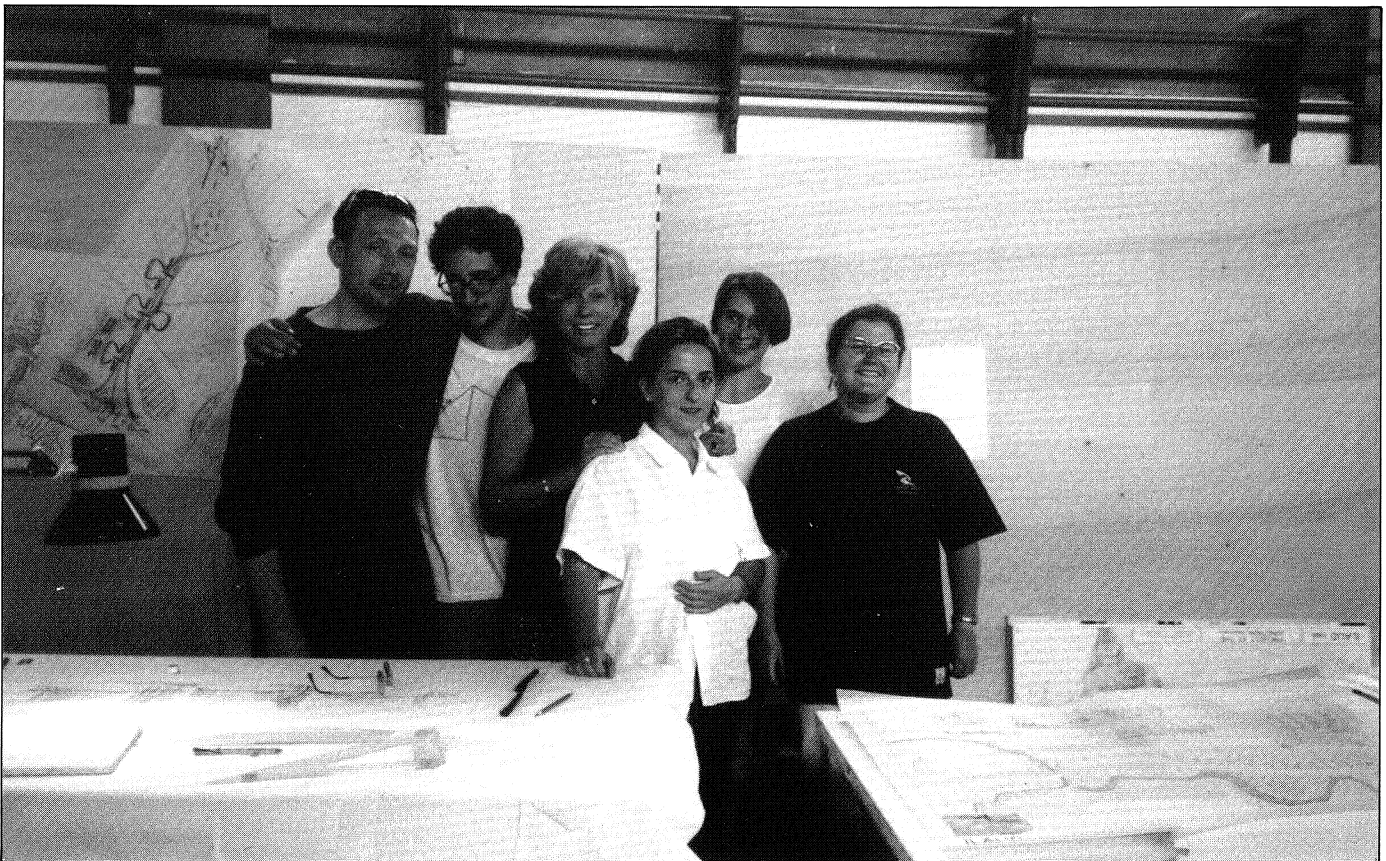
EL EQUIPO EN EL TALLER.