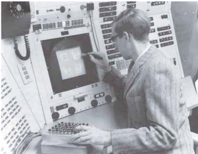
Fig. 7: Ivan Sutherland utilizando el programa Sketchpad en la consola TX-2 en el Lincoln Laboratory del MIT, 1963

subsistemas, la acentuación paramétrica, la figuración paramétrica, la sensibilidad paramétrica y, finalmente, el urbanismo paramétrico que integraría a todos los anteriores.