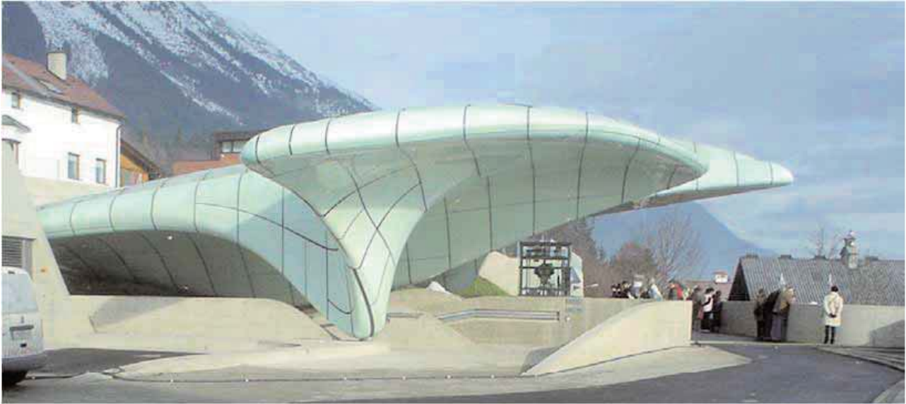
Fig. 4: Nordpark Cable Railway Station, Zaha Hadid Architects, Innsbruck, Austria, 2004-2007

espacios geométricos topológicos no euclídeos, a la aplicación de sistemas cinéticos y dinámicos y al empleo de criterios de diseño paramétrico y algorítmico, que están sustituyendo a los planteamientos tecnológicos de la arquitectura tradicional. (6)