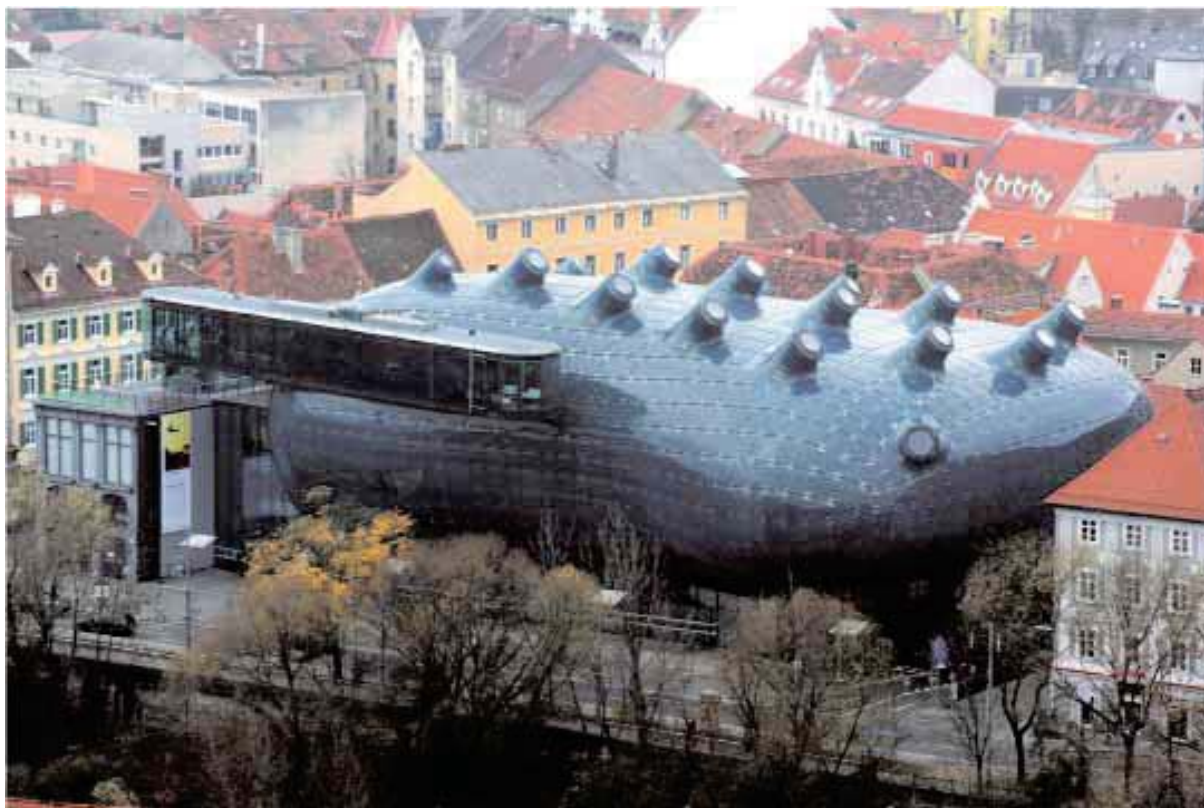
Fig. 3: Kunsthaus, Peter Cook & Colin Fournier, Graz, Austria, 2003

En consecuencia nos encontramos ante un nuevo cambio de tendencia, una arquitectura digital de segunda generación, que podría calificarse incluso como “post-digital”, en la que el arquitecto se convierte en diseñador de sistemas y procesos, en la línea ya marcada inicialmente por algunos pioneros como Gordon Pask al considerar que “el diseño es control del control”. (4)