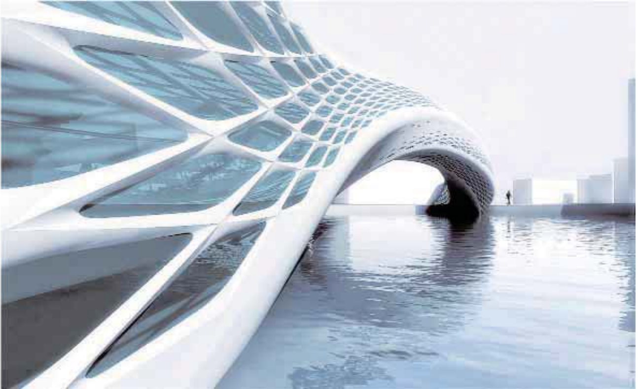
Fig. 5: Non-Linear Arch. Tutor Daniel Gillen, Parametric Design Workshop, THU, Beijing, 2010

generalmente en aspectos no estructurales (control ambiental, iluminación, elementos móviles de muros, etc...). Pero lo cierto es que el concepto de participación real en el diseño aún no ha sido asimilado de forma general y plantea grandes problemas.