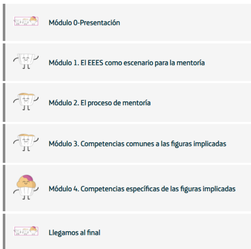
Figura 3. Estructura del Curso MOOC en la plataforma Miríadax

El principal resultado de esta experiencia es el Curso en sí mismo, que adquirió el formato que se muestra en la Figura 3.