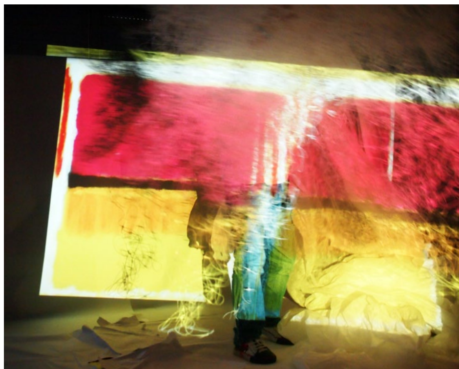
Imágenes 4, 5, 6, 7, 8 y 9. "Proyecto con alumnado de Infantil en el CEIP de Sigüeiro, 2016", Mesías-Lema, 2019, p. 172-173.