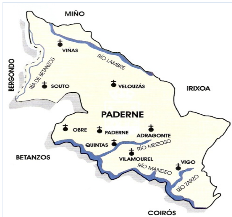
Imagen 1. Área de investigación