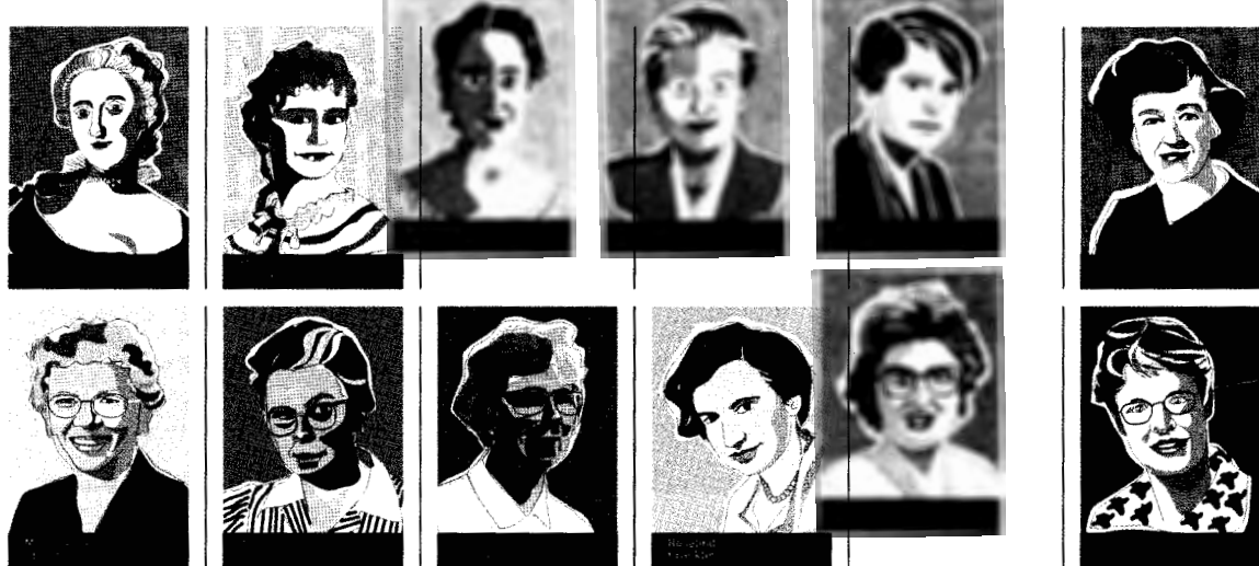
Figura 1. Diseño gráfico de cada una de las investigadoras elegidas para la Exposición y el Calendario 2016.