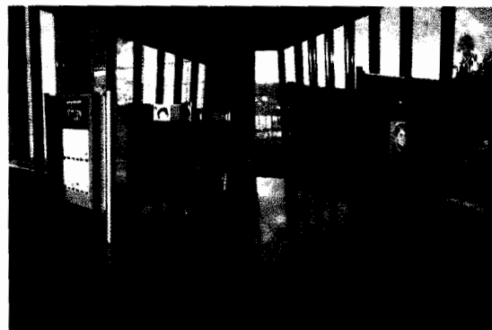
Figura 3. Exposición en la Universidad Autónoma de Madrid.

Las causas de la baja presencia femenina en las titulaciones de ingeniería y las llamadas "ciencias duras" son complejas y no ha sido la intención de