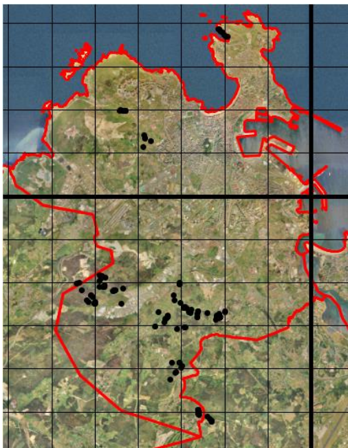
Figura 1: Localización de los puntos de muestreo realizados en el concello de A Coruña para detectar anfibios y reptiles. En algunos casos, un punto puede señalar más de una zona de muestreo, debido a la escala del mapa.

Los lugares que cuentan con una mayor riqueza de especies de reptiles fueron el polígono industrial de Vío, el Castro de Elviña y el monte de A Zapateira, zonas todas ellas periféricas del concello de A Coruña, observando 5 especies de reptiles diferentes en cada una de las zonas.