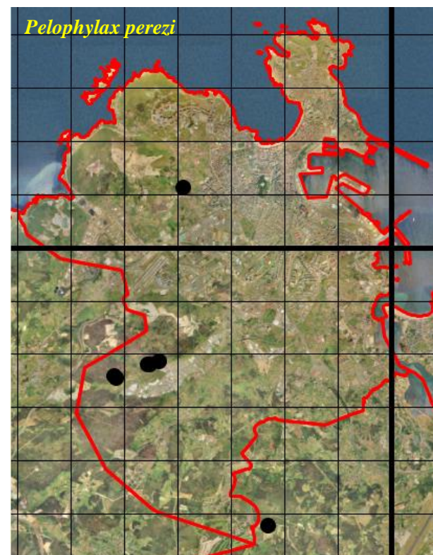
Figura 3: Mapas de distribución de las especies de anuros en el concello de A Coruña. Los puntos muestran las localidades de observación, en relación a cuadrículas UTM de 1 x 1 km (trazo fino). En trazo grueso se muestran las cuadrículas UTM de 10 x 10 km.