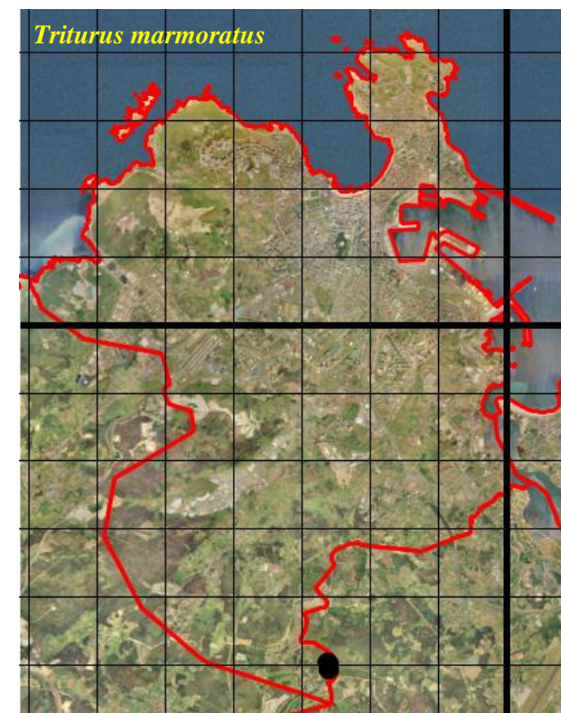
Figura 2: Mapas de distribución de las especies de urodelos en el concello de A Coruña. Los puntos muestran las localidades de observación, en relación a cuadrículas UTM de 1 x 1 km (trazo fino). En trazo grueso se muestran las cuadrículas UTM de 10 x 10 km.