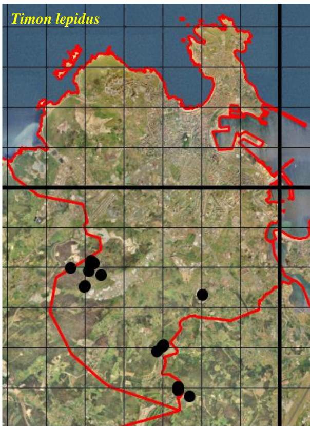
Figura 4: Mapas de distribución de las especies de saurios en el concello de A Coruña. Los puntos muestran las localidades de observación, en relación a cuadrículas UTM de 1 x 1 km (trazo fino). En trazo grueso se muestran las cuadrículas UTM de 10 x 10 km