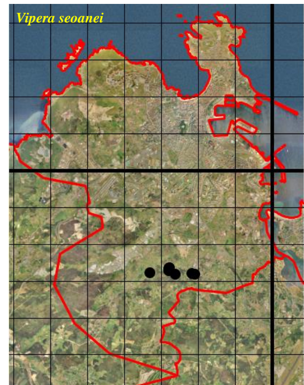
Figura 5: Mapas de distribución de las especies de ofidios en el concello de A Coruña. Los puntos muestran las localidades de observación, en relación a cuadrículas UTM de 1 x 1 km (trazo fino). En trazo grueso se muestran las cuadrículas UTM de 10 x 10 km