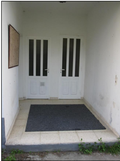
Ilustración 16 Puertas de acceso al interior

Previo al acceso a la entrada principal del edificio se encuentra un escalón de 4 cm. Las puertas de las salas del edificio tienen diferentes anchuras: la del aula de actividades tiene una anchura de 90 cm, mientras que las que dan acceso al primer piso solo son de 70 cm, por debajo del mínimo establecido por ley.