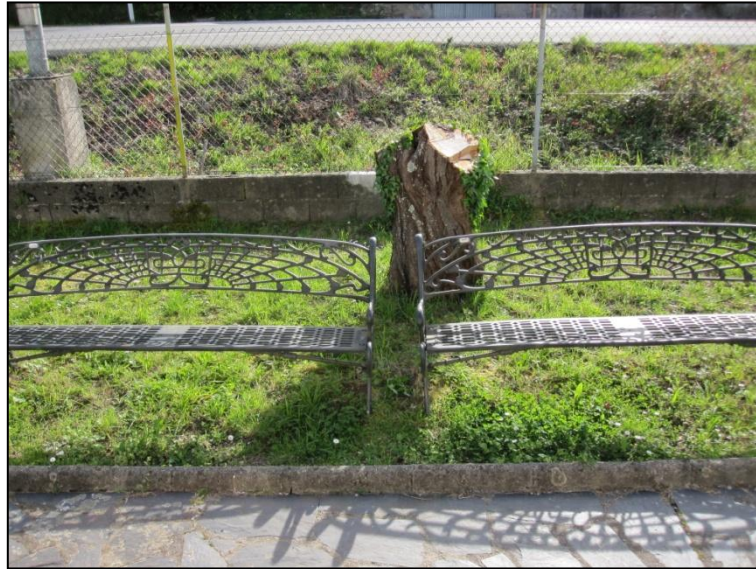
Ilustración 11 Bancos en el exterior del edificio

En el itinerario de acceso al edificio encontramos una papelera, situada fuera del itinerario peatonal, a una altura de 125 cm. Situado en una zona de largo recorrido y sin interrumpir la circulación se encuentra un banco, y justo en frente de este un bordillo de 10 cm que sería un obstáculo para personas con movilidad reducida.