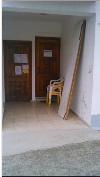
Ilustración 19 Puertas de acceso al interior