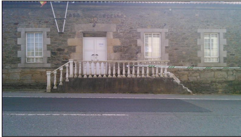
Ilustración 9 Fachada de la casa municipal

En la entrada principal del edificio se encuentra un panel informativo que indica que estamos en la "Casa do Concello". Esta señalización no es visible a distancia debido a su tamaño y a la falta de contraste.