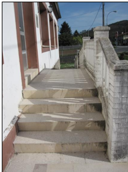
Ilustración 13 Escalón en la puerta de acceso al interior

El ancho de la puerta es menor, 60 cm, a lo establecido por ley, 80 cm. Por otro lado, si se abren las dos hojas de la puerta el ancho total, 125 cm, permitiría el paso de una silla de ruedas. El acceso peatonal del exterior al interior del edificio se ve interrumpido por un escalón de 8 cm.