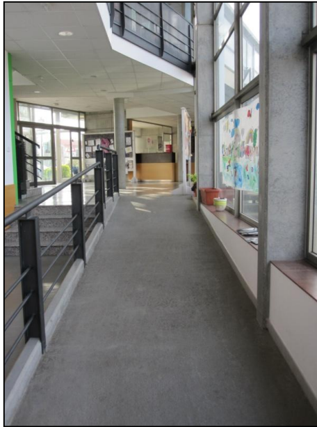
Ilustración 4 Pasillo y rampa interior

1.4.2.3 Baño adaptado: La puerta es abatible, abre hacia al exterior y tiene una anchura libre de paso suficiente para permitir el acceso de las personas usuarias de silla de ruedas, bastones, etc. La manilla y el herraje de apertura de la puerta son de fácil manipulación. Las dimensiones del interior del aseo permiten el giro de una silla de ruedas y el lavabo permite la aproximación frontal de una persona en silla de ruedas. Respecto al inodoro es de 40 cm de alto y cuenta con barras de ayuda abatibles para facilitar las transferencias a ambos lados. Por otro lado los accesorios están a una altura accesible para que personas en sillas de ruedas puedan utilizarlos la iluminación es adecuada. Cabe destacar que el pavimento del aseo no es antideslizante.