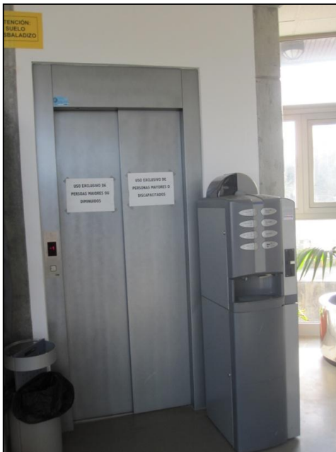
Ilustración 2 Ascensor

1.4.1.2 Ascensor: En relación al acceso al ascensor cabe destacar que ni la puerta ni el marco exterior presentan una coloración viva y contrastada con el entorno. La puerta tiene un ancho de 82cm. En el interior del ascensor existe una pequeña pantalla que indica mediante número en que planta se encuentra el ascensor, pero no presenta una señal acústica para indicar la apertura de las puertas, ni tampoco la planta en la que se encuentra en ese momento. Los botones se encuentran a una altura de 110 cm. Tienen un tamaño correcto y los números se distinguen fácilmente de la superficie del ascensor.