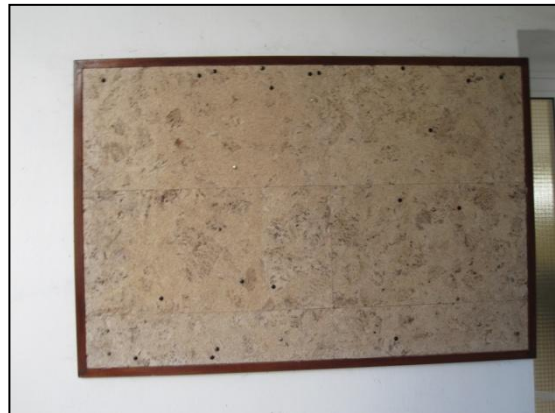
Ilustración 2. Tablón del Centro Social de Figueiras