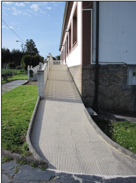
Ilustración 10 Rampa de acceso al interior

Se puede acceder a la primera planta tanto por escaleras como por rampa exterior. En lo referente a la rampa está constituida por una pendiente longitudinal, con barandilla y cuyo pavimento es uniforme y antideslizante.