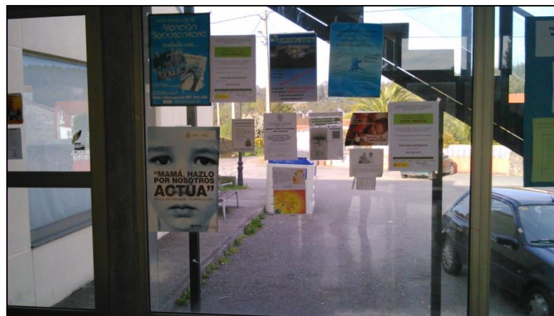
Ilustración 3. Tablón Edificio Multiusos