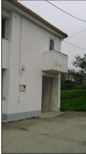
Ilustración 18 Ausencia de un panel informativo

No hay ningún panel informativo que indique que estamos en el centro social de Queiris.