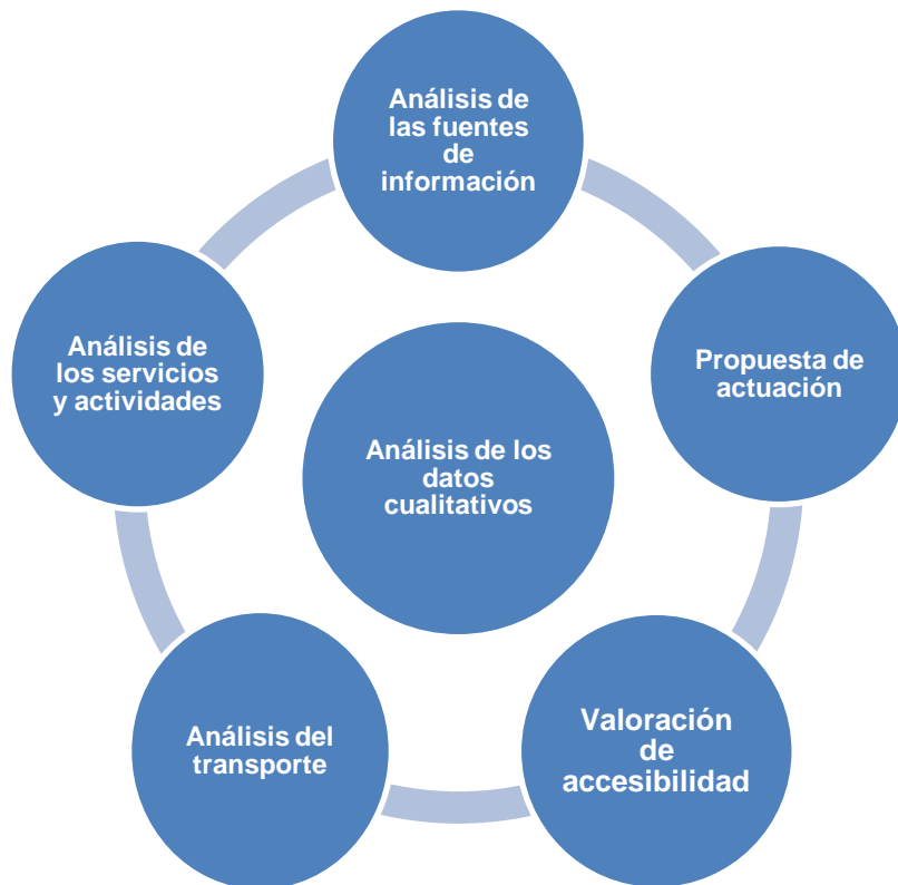
Tabla 4 Esquema general de los resultados

A continuación se presentan los diferentes resultados obtenidos en este trabajo de investigación. Entre ellos se encuentra el análisis del discurso de los participantes que nos muestran las barreras y facilitadores del entorno con los que se encuentran las personas en situación de dependencia que viven en un medio rural. Así mismo, se realizaron diferentes análisis de entorno que facilitan y complementan la comprensión de los resultados. Finalmente se realizó una propuesta de actuación desde terapia ocupacional a partir de las necesidades y prioridades encontradas.