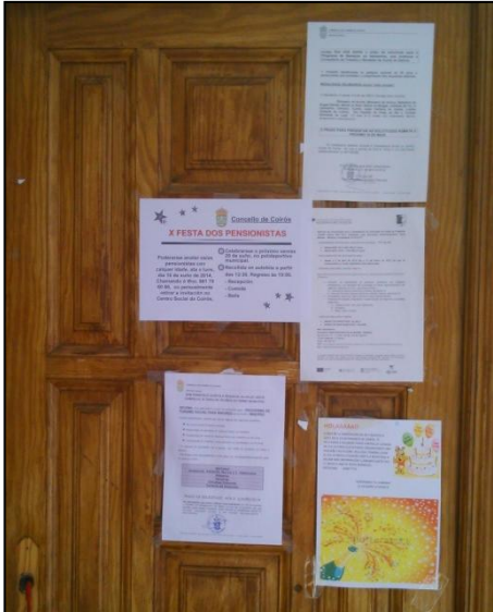
Ilustración 1. Tablón del Centro Social de Queiris