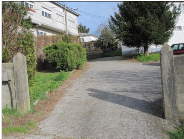
Ilustración 15 Pendiente de acceso al edificio

El único acceso al centro social de Figueiras se realiza a través de una pendiente de gran inclinación, que dificulta o imposibilita el acceso a las personas con movilidad reducida.