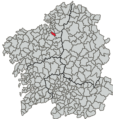
Ilustración 1 Localización geográfica del municipio de Coirós

Aunque la distribución territorial interna no se concentra en ninguna de las parroquias, se pueden destacar, únicamente, las de San Xulián de Coirós y Santa María de Ois. Destaca especialmente el hecho de que el 92,8% da población se agrupa en núcleos dispersos 12 .