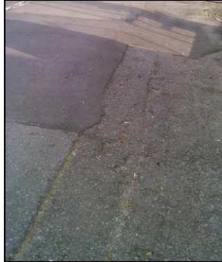
Ilustración 6 Irregularidades en el pavimento

En el pavimento del itinerario peatonal de acceso a la casa municipal se distinguen diferentes obstáculos. La presencia de un suelo deslizante e irregular (resaltes entre piezas) podrá llegar a dificultar el acceso a personas con movilidad reducida.