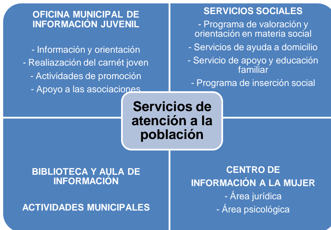
Tabla 6 Servicios y programas de atención a la población

Un 11.4% de la población total del municipio de Coirós presenta algún tipo de discapacidad. La discapacidad de tipo físico es la más frecuente, con un 66.67%, seguida por la discapacidad de tipo psíquico, 23.56%, y sensorial, 9.77%. Así mismo, respecto al grado que más se repite, con un 61.5%, es el que se encuentra en el intervalo del 33-64%, seguido del intervalo de 65-74% (con un 20.12%) y por último, el menos frecuente es el situado en el intervalo del 75% o más, con un 18.38% del total de las personas con discapacidad 23 .