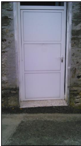
Ilustración 8 Puerta de acceso a las oficinas municipales

El ancho de todas las puertas que acceden al interior de la casa municipal es correcto, en todos los casos superiores a 80 cm. Con todo, las puertas que permiten acceder a las oficinas municipales puerta presentan un escalón de 7 y 8 cm, lo dificulta o imposibilita el acceso a personas con movilidad reducida.