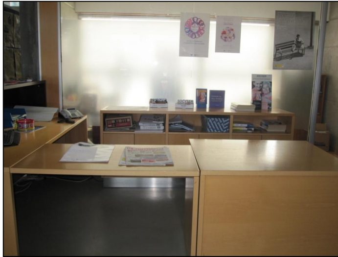
Ilustración 5 Mostrador de información