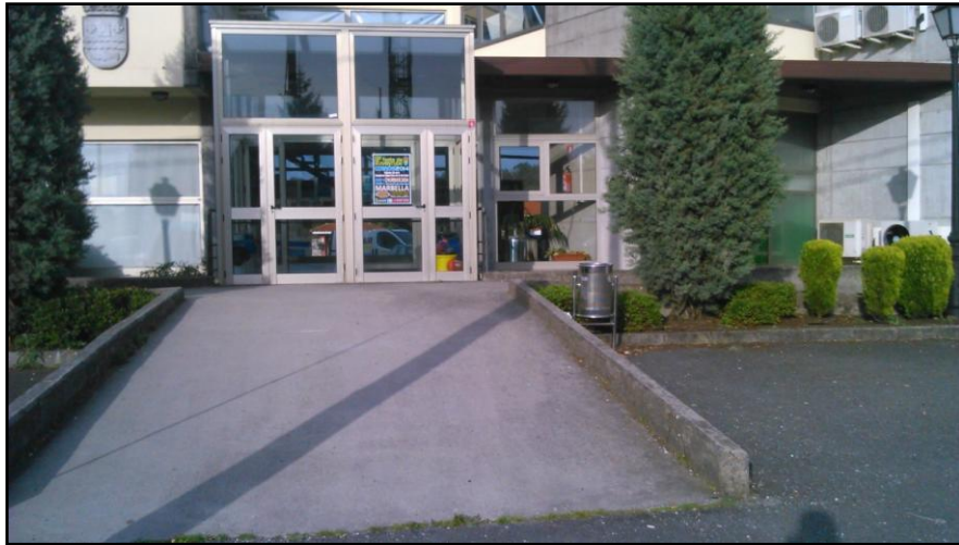
Ilustración 1 Acceso al interior del edificio

El acceso al interior del edificio se realiza a través de una rampa constituida por una pendiente longitudinal, sin barandilla y cuyo pavimento es uniforme y antideslizante.