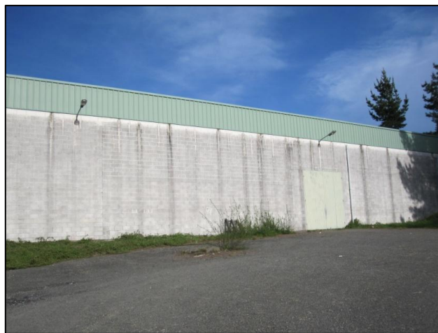
Ilustración 22 Puerta de acceso al polideportivo

No hay ningún panel informativo que indique que estamos en el polideportivo del complejo deportivo “A Cortella”.