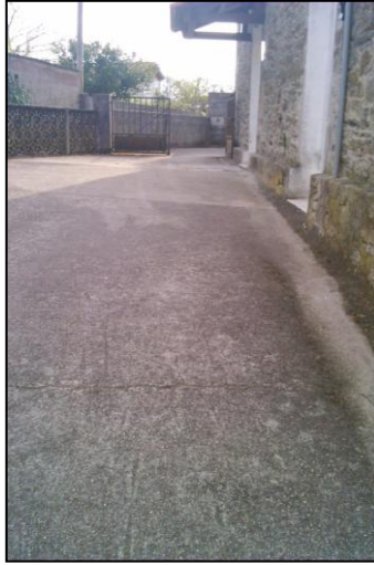
Ilustración 7 Pendiente de acceso a las oficinas municipales y a la escuela