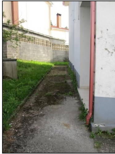
Ilustración 14 Pavimento en malas condiciones