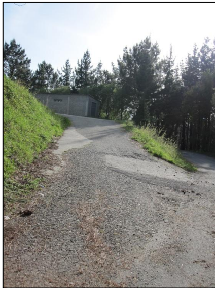
Ilustración 20 Malas condiciones del pavimento

Existen tramos del itinerario de acceso al polideportivo que no reúnen las condiciones mínimas de accesibilidad ya que consta de resaltos e irregularidades en el pavimento.