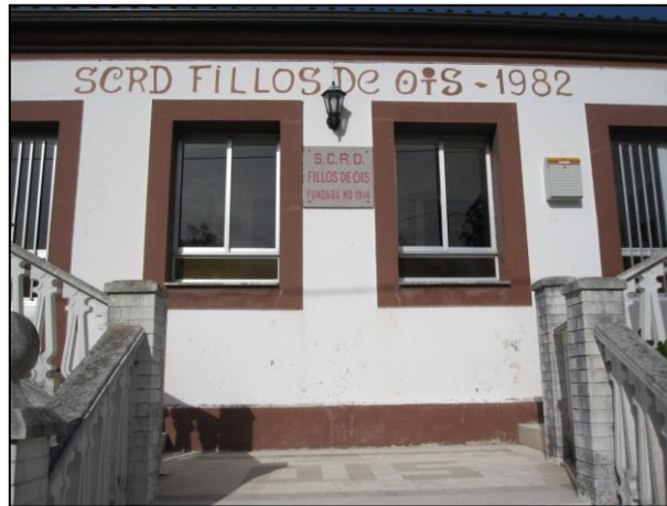
Ilustración 12 Señalización exterior del centro social