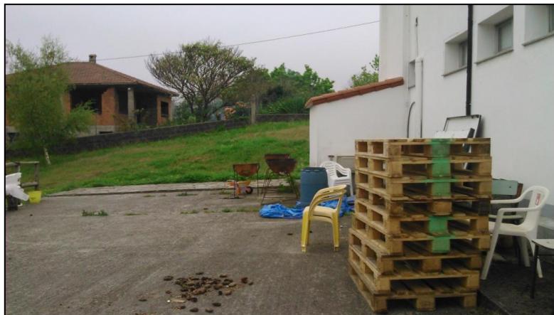
Ilustración 17 Obstáculos en los alrededores del edificio

El itinerario que llega hasta la puerta del centro social reúne las condiciones mínimas de accesibilidad, aunque su situación es mejorable ya que existen resaltos en el pavimento así como diferentes obstáculos (sillas, palets...)