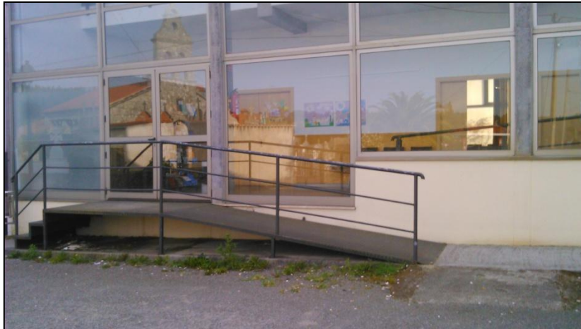
Ilustración 3 Salida de emergencia

1.4.1.3 Sistemas de alarma y emergencia: El acceso al exterior por la salida de emergencia se realiza por una rampa exterior. Cabe destacar que la ruta de salida de emergencia no está señalizada.