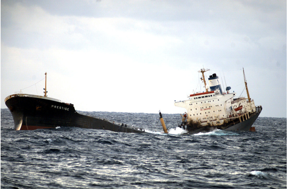
Imagen 1: El hundimiento del “Prestige” como “accidente normal” (Charles Perrow) en contextos de tecnología de alto riesgo.

Lo que Perrow viene a mostrar después del análisis detallado de diversos sucesos catastróficos (como el accidente de la central nuclear de Three Mile Island ) es que, dada su complejidad interna y sus relaciones con el entorno, los sistemas tecnológicos están abocados al accidente y que, allí donde se produce, no es por causa de un mal funcionamiento del sistema sino que es inherente a su funcionamiento normal. El corolario es claro: ya que el accidente es “normal”, parece ingenuo perseguir el ideal de una seguridad absoluta.