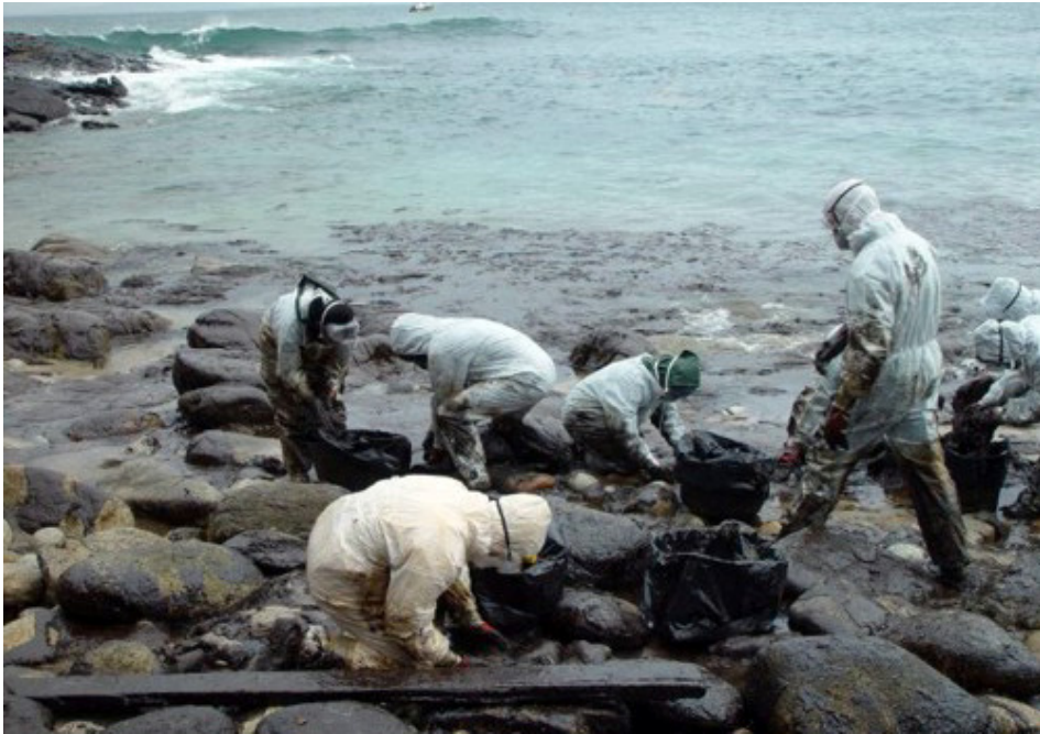
Imagen 2: Labores de limpieza de rocas en la costa gallega como “situación normal” en la sociedad del riesgo.

Frente a la imagen anterior, en esta lo que destaca es que la tecnología sólo aparece en la modesta forma de unas mascarillas, unos guantes, unos cubos y unos trajes de faena. La tecnología no aparece, aunque todos sabemos que está detrás. Ya conocemos que la imagen 2 no es posible sin la imagen 1, del mismo modo que la sociedad del riesgo no aparece si no apareció antes la sociedad industrial.