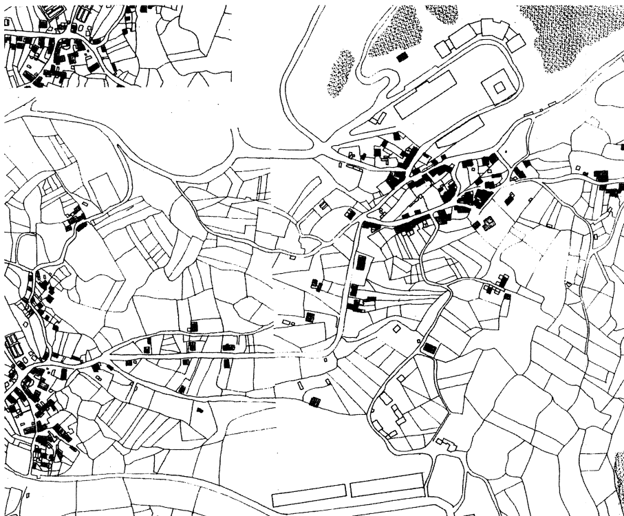
Núcleo de Elviña, trabajo de Urbanística I, plan nuevo.

La primera asignatura que se cursa en la Escuela, Urbanística I, con clara orientación práctica hacia el aprendizaje en los temas de escala a partir de análisis territoriales y urbanos, pone su acento teórico en la historia de los trazados urbanos y las teorías de la Ciudad, e introduciendo al alumno en los conceptos de estructura y morfología urbana a partir de los elementos del análisis urbano.