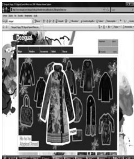
Figura 3. Web general de la marca