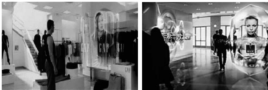
Figuras 1 y 2. Imágenes de la película Minority Report

Es en este terreno, la publicidad exterior es una de las áreas donde se dan los más recientes y llamativos avances. Se ha evolucionado en el desarrollo de vallas publicitarias digitales con un mayor contenido de interactividad. La empresa IBM trabaja en el desarrollo de chips RFID (Radio Frequency Identification) donde la información que aparece registrada en el móvil y las tarjetas de créditos se emite a un receptor ubicado en las vallas publicitarias y de esta forma puede conocer edad, género, hábitos de compra y modelar el mensaje 1 . Por su parte la compañía japonesa NEC desarrolla un proyecto denominado Next Generation Digital Signage Solution que desarrolla un software de reconocimiento facial que permite identificar la edad y el género y que igualmente mediante tecnología wireless transmite información al soporte publicitario que adapta su mensaje al consumidor 2 .