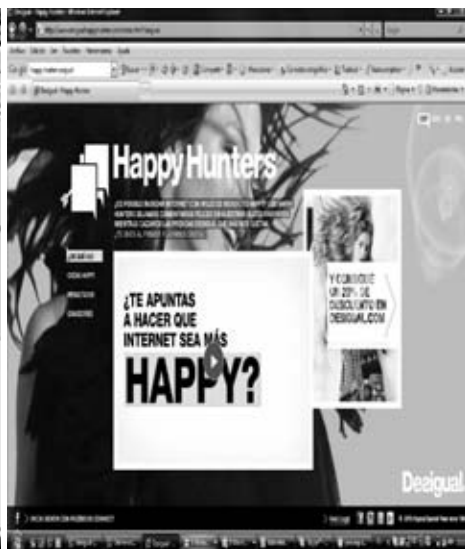
Figura 4. Microsite